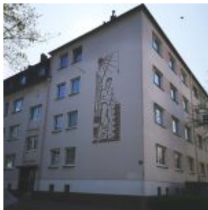
[Alle Fotos wurden aufgenommen am 14. April 2022.]