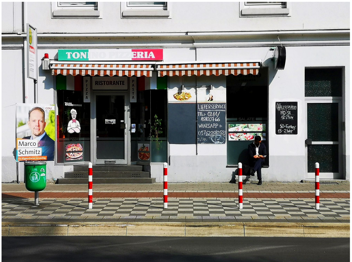
Die Pizzeria an der Haltestelle Richardstraße

Ruhig und friedlich ist die Schlesische Straße, und diese Ruhe und dieser Frieden setzt sich in den Seitenstraßen fort. Hier finden sich teils Einzelhäuser aus der Gründerzeit, aber vor allem kleinere Mietshäuser und viele Einfamilienhäuser mit Gärten. Diese Straßen tragen vorwiegend (die deutschen Versionen der) Namen von Orten aus Schlesien: Posen ist vertreten, und die Posener Straße bildet das direkte Gegenstück zur Schlesischen; Breslau, Liegnitz, Gleiwitz, Torgau, Leuthen, Glogau, Hohenfriedberg sind vertreten.