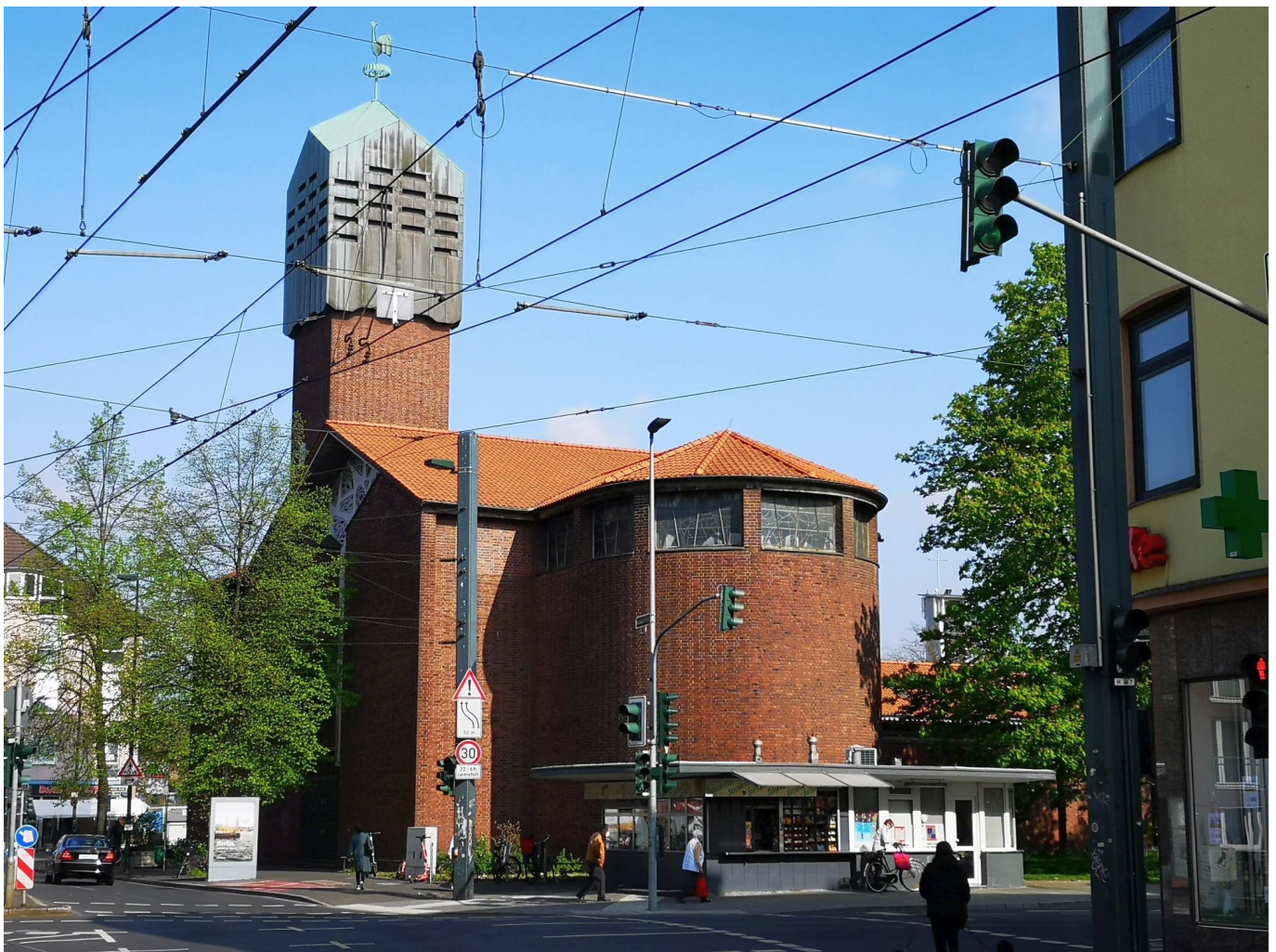
Die Michaelskirche am ÖPNV-Knotenpunkt Schlesische Straße

Immerhin, und das war für die zugezogenen Katholiken wichtig, bestand ab 1912 bereits die St. Michaelskirche an der Ronsdorfer Straße, die genau als Teil der Infrastruktur errichtet wurde, die für die neuen Düsseldorfer nötig war. Allerdings in erster Linie für die Belegschaft der Mannesmann-Stahlwerke entlang der Erkrather Straße. Heute bildet die Kirche St. Michael die Landmarke an der Kreuzung der Reisholzer mit der Schlesischen Straße, einem wichtigen Knotenpunkt des ÖPNV. Übrigens: Die Kirche wurde nach dem Krieg wiederaufgebaut, nur der Turm und seine Haube entstanden neu. In den Neunzigern kam die Idee auf, das Ding einfach abzureißen, weil es einfach überdimensioniert war. Stattdessen hat man die Kirche zwischen 2004 und 2007 einfach durch den Abriss des alten Langhauses verkleinert.