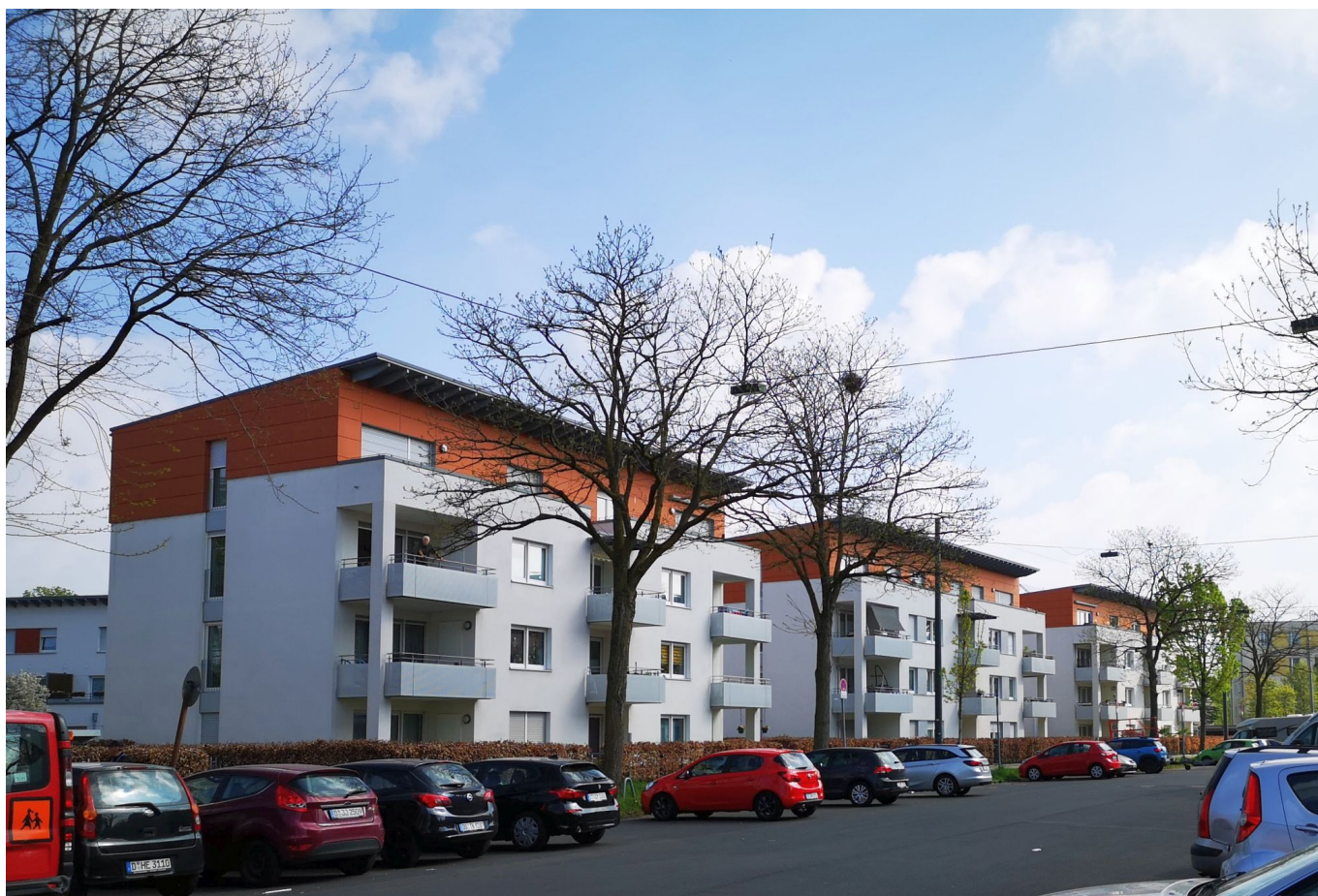
Die modernen Klötzchenbauten am Ende der Schlesischen Straße

Die Schlesische Straße ist breit und großzügig angelegt; auf der Nordseite gibt es teils überbreite Gehwege mit kleinen Rasenflächen dazwischen. Ab der Oderstraße hat man freie Sicht durch die fast schnurgerade Straße Richtung Osten bis zum Ende. Auffällig ist das Fehlen von Läden und von Gastronomie. Die leicht angeranzte Pizzeria Tonino hatte früher einen sehr guten Ruf, scheint den aber nicht mehr erfüllen zu können (will man den Google-Rezensionen glauben). Und dann ist da noch der Schweidnitzer Hof, der den ganzen Charme einer traditionellen Eckkneipe ausstrahlt, obwohl er in einem furchtbar hässlichen Siebzigerjahrehaus lebt.