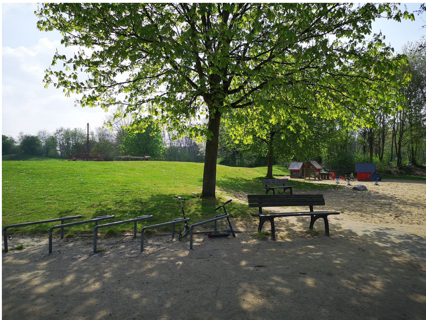
Der hübsche Nachbarschaftspark Am Hackenbruch am Ende der Schlesischen Straße

Das Gute an der ganzen Gegend ist, dass sie kein bisschen hip und cool ist und von der Gentrifizierung bislang verschon geblieben ist, obwohl sie gerade für Familien mit Kindern attraktiv ist. Denn am Ende der Schlesischen Straße erstreckt sich eine der am wenigsten bekannten Grünanlagen der Stadt: der Nachbarschaftspark am Hackenbruch. Hier gibt es sanfte Rasenhügel, Spielwiesen, Basketballfeld und Spielgeräte verschiedener Art sowie einen Hundeauslauf. Und weil die Schlesische Straße nur mit wenig Autoverkehr belästigt wird und die drei Buslinien, die aus der Richardstraße Richtung Reisholzer Straße abbiegen, nicht allzu oft vorbeikommen, ist auch die Verkehrslage sehr angenehm.