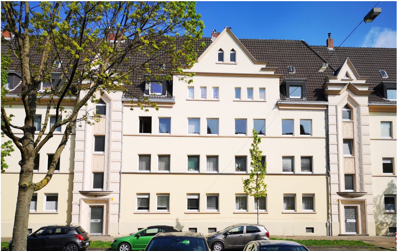
Eines der schönen Mietshäuser an der Schlesischen Straße

Den alten Teil der Straße bilden die mehrstöckigen Mietshäuser zwischen St. Michael und der Kreuzung mit der Richardstraße. Obwohl sie innerhalb von nur zwei oder drei Jahren errichtet wurden, sind verschiedene Baustile jener Zeit vorhanden. Das spricht dafür, dass es sich um keine öffentliche Wohnbaumaßnahme handelte, sondern die einzelnen Häuser individuell von verschiedenen Eigentümern erbaut wurden. Vergleicht man die Stadtpläne, standen da 1922 auf der gesamten Länge zunächst nur drei solcher Häuser. 1940 war dann alles bis zur genannten Kreuzung bebaut.