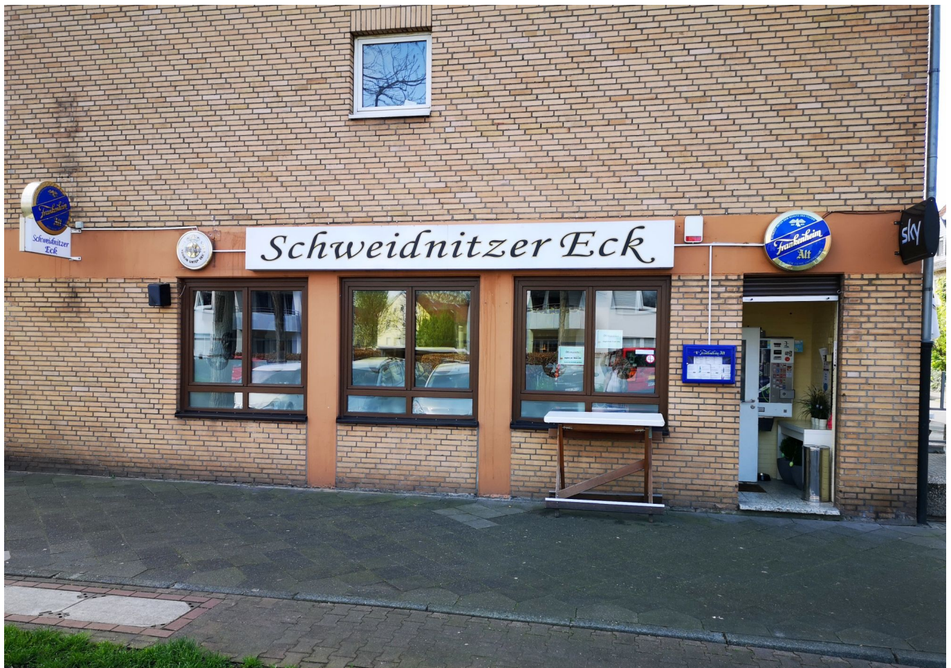
Das Schweidnitzer Eck – ein echte Eckkneipe an der Schlesischen Straße

Ansonsten gibt es noch ein ebenfalls traditionelles Büdchen und den erwähnten Laden für polnische Lebensmittel weiter oben. Das Tabak-und-Schreibwarengeschäft an der Ecke Richardstraße hat leider zum 1. April 2022 für immer aufgegeben. Also konzentrieren sich die Anwohner:innen beim Einkaufen auf die Reisholzerstraße, die ja gerade rund um die Haltestelle Schlesische Straße jede Menge Lebensmittel- und andere Läden bietet. An dieser Stelle wird dann die Zugehörigkeit der Straße zu Eller deutlich, denn diese wuselige Kreuzung bildet den nördlichen Endpunkt dieses ganz eigenen Stadtteils.