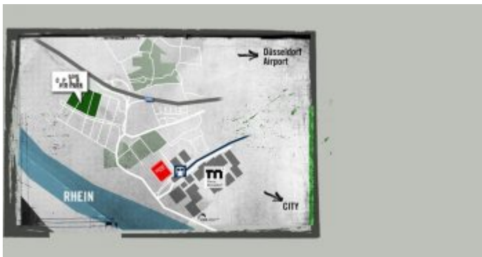
D.Live Open-Air-Park: Geländeplan