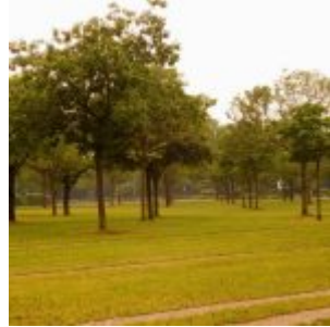
Hier stehen die 104 Bäume, die gefällt werden sollen