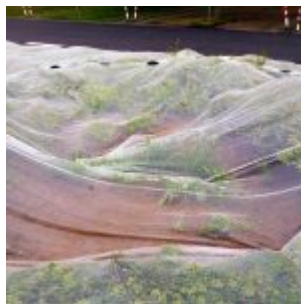
Hier standen die umgesetzten Bäume