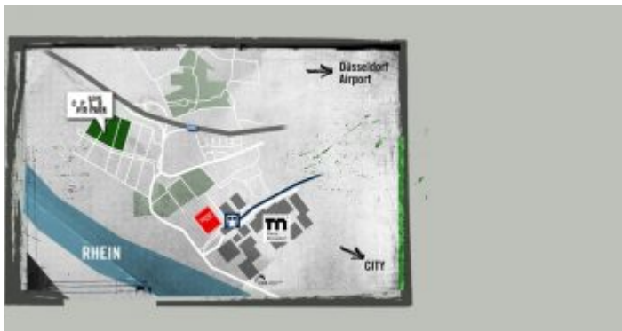
D.Live Open-Air-Park: Geländeplan