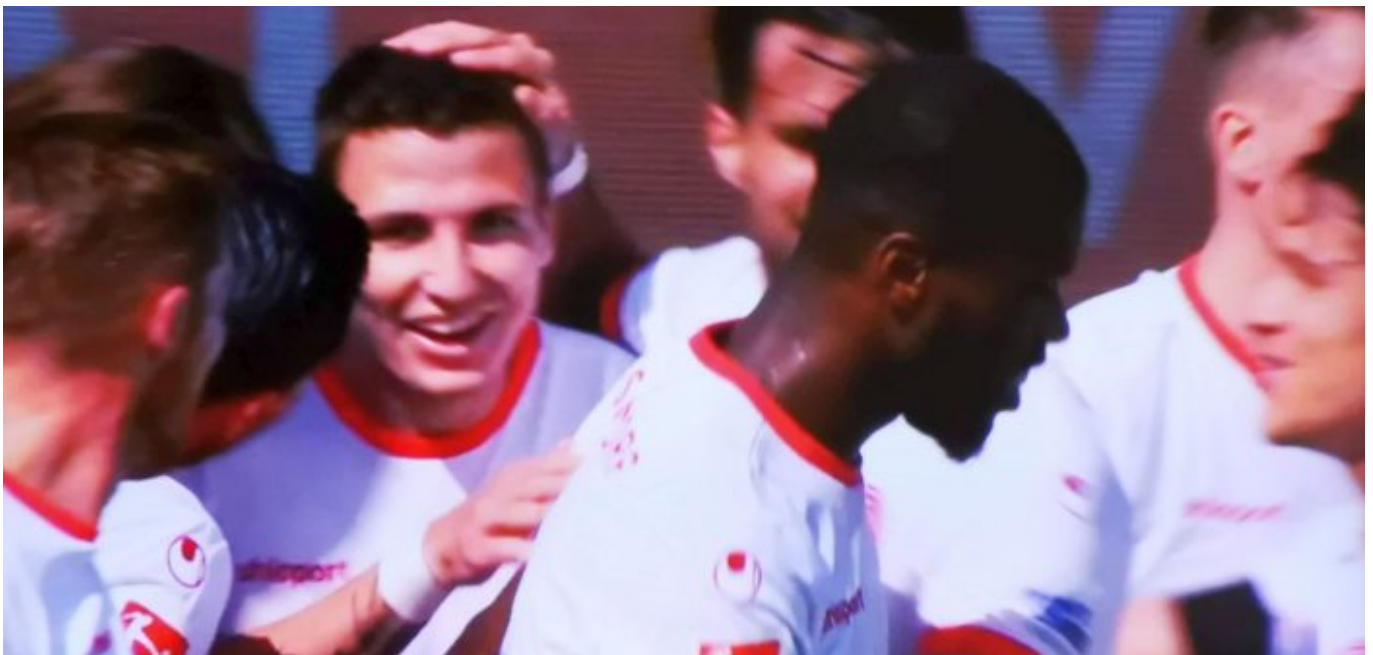
Osnabrück vs F95: Torschütze Cello nach dem 3:0 Im Kreise seiner Lieben (Screenshot Sky)

Wir alle wissen, dass du als ehemaliger Vollblutstürmer einer bist, der den Offensivfußball liebt, dieses Getümmel aus Steil- und Doppelpässen, rasansten Konterdribblings, Flankenläufen und Massen an Torschüssen. Da fragt sich dein Ergebener, warum die glorreiche Fortuna unter deiner Führung das so selten hinbekommen hat. Gestern gegen die wirklich erschreckend schwachen Osnabrücker gab es eine Reihe feiner Spielzüge und auch recht viele Torschüsse, aber von einem Wirbel konnte keine Rede sein. Stellenweise war's wieder so öde wie so vielen Spielen zuvor. Immerhin ist die Zahl er herausgespielten Chancen seit dem 23. Spieltag kontinuierlich gestiegen. Das dürfte dein Verdienst sein.