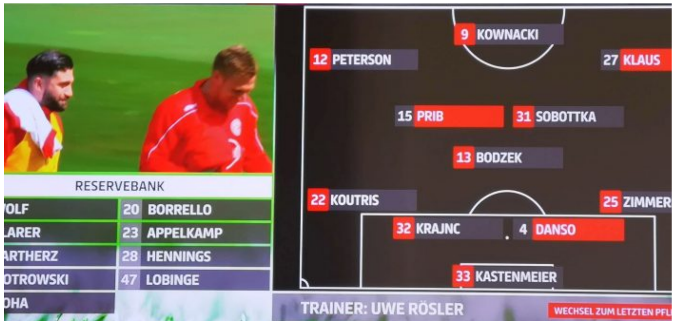
Osnabrück vs F95: Die Aufstellung (Screenshot Sky)

Borrello ebenfalls nicht. Wobei: Nach seiner Einwechslung spielte Brandon wieder hauptsächlich beim FC Borrello.