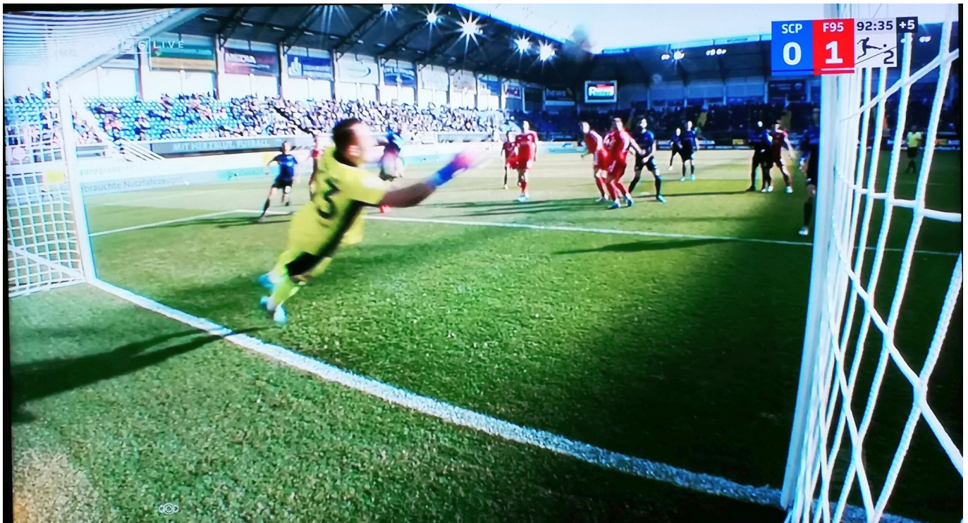
Paderborn vs Fortuna: Der alles in allem verdiente Ausgleich

Dieser unangenehme Typ, der sich SCP-Trainer schimpft, verlor nach dieser Entscheidung völlig die Fassung und entblödete sich vor laufender Kamera nicht, den Schiedsrichter auf übelste Weise zu diffamieren. Ähnliches gab er in der PK nach dem Spiel, assistiert vom Paderborn-Pressesprecher mit ungeheuerlichen Suggestivfragen, wieder zum Besten. Der Ergebnisse sagt ganz klar: Kwasniok gehört bestraft. Und: Ihm ist dieser 1985 durch feindliche Übernahme und erzwungene Fusion entstandene Club heute noch einen Tacken unsympathischer geworden.