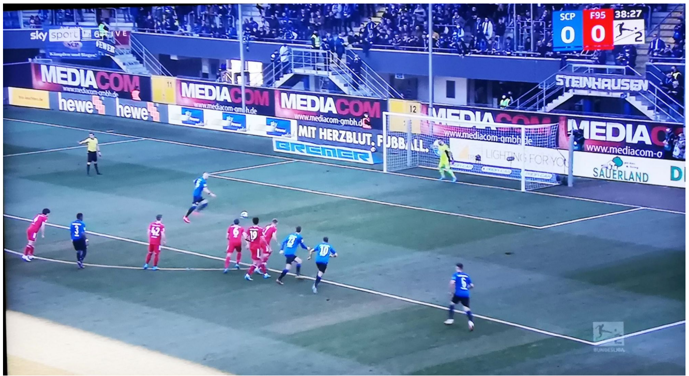
Paderborn vs F95: Der vergeigte Elfer...