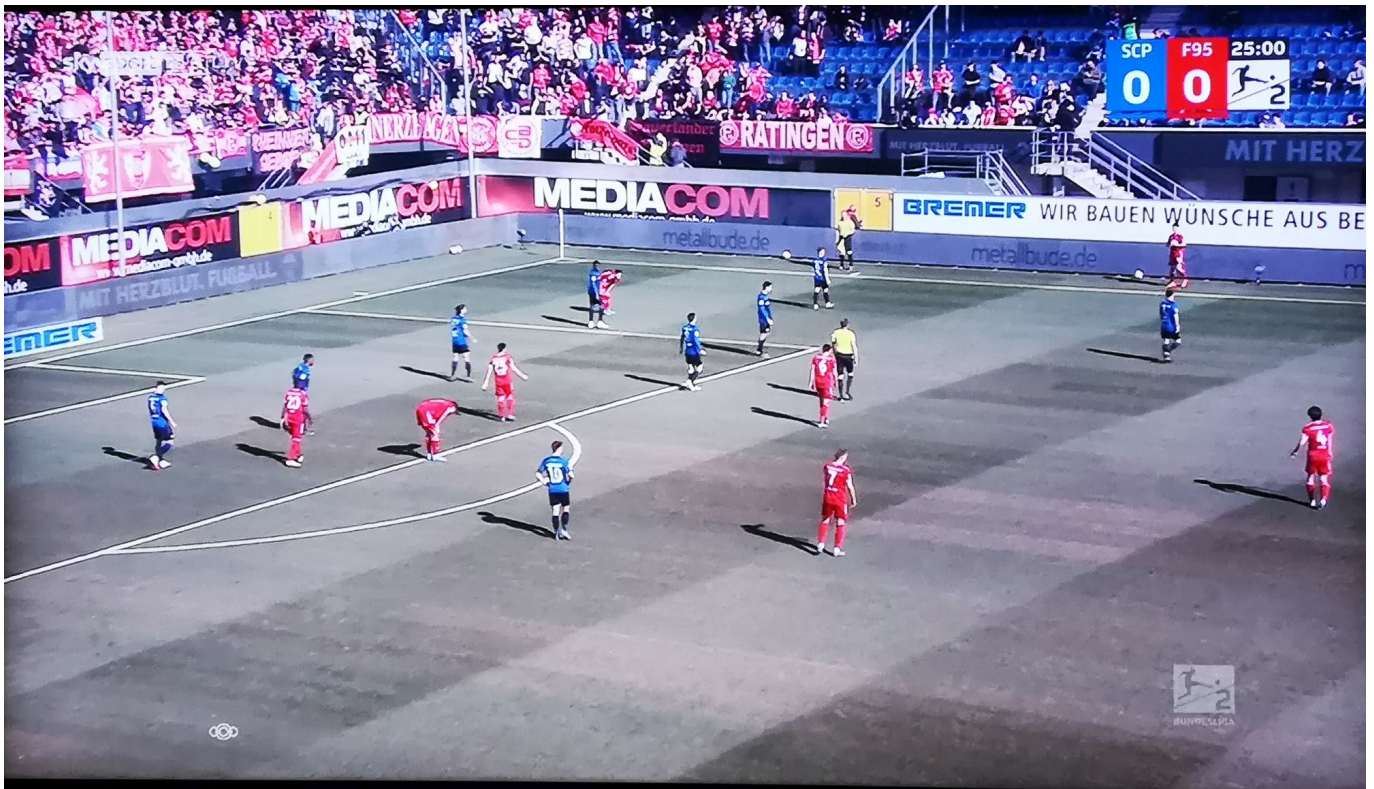
Paderborn vs F95: So viel Druck übte Fortuna in der ersten Halbzeit aus