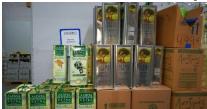
Feine Öle in schicken Kanistern

Weil schon zu den Zeiten, als Polichronidis nur Großhandel betrieb, viele Griechen aus weitem Umkreis kamen, um sich mit den geliebten Produkten der Heimat zu versorgen, betreibt man seit ein paar Jahren auch ganz offiziell Einzelhandel. Zig Stammkunden haben es auf den frischen Fisch abgesehen oder auf die bereits erwähnten feinen Weine. Wieder andere kaufen – außer dem besonderen Nescafé – Lebensmittel, Süßigkeiten und Spezialitäten der Heimat, die man sonstwo kaum bekommt. Und dann ist da noch die Auswahl an Olivenöl – teils selbst importiert. Hier gibt es herrliche Sorten in 5-Liter-Kanistern zu unerwartet günstigen Preisen. Inzwischen haben auch die deutschen Griechenland-Freunde diese Quelle entdeckt. Und so herrscht in der weitläufigen Halle mit den Kühlbereichen für Fisch und Fleisch oft ein reges Treiben.