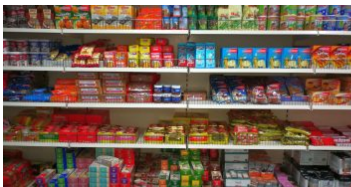
Jede Menge griechischer Spezialitäten

Wie käme der durchschnittliche Grieche durch den Sommer ohne seinen Frappé ? Vermutlich gar nicht. Denn dieses Eiskaltgetränk aus stark gesüßtem Instantkaffee und Eiswürfeln ist erfrischend und muntermachend wie kein anderes. Funktioniert aber richtig nur mit einer bestimmten Sorte Nescafé. Also sind Griechen und Griechenland-Freunde in unseren Breiten ständig auf der Suche nach Quellen für das Koffeingranulat. Haben sie dann die Polichronidis Handels GmbH mit ihrem Lager an der Volksgartenstraße entdeckt, ist die Suche vorbei. Und wer einmal dort war, wird mit höchster Wahrscheinlichkeit Stammkunde.