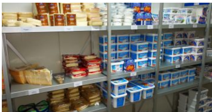
Reiche Auswahl an griechischem Käse

Weil schon zu den Zeiten, als Polichronidis nur Großhandel betrieb, viele Griechen aus weitem Umkreis kamen, um sich mit den geliebten Produkten der Heimat zu versorgen, betreibt man seit ein paar Jahren auch ganz offiziell Einzelhandel. Zig Stammkunden haben es auf den frischen Fisch abgesehen oder auf die bereits erwähnten feinen Weine. Wieder andere kaufen – außer dem besonderen Nescafé – Lebensmittel, Süßigkeiten und Spezialitäten der Heimat, die man sonstwo kaum bekommt. Und dann ist da noch die Auswahl an Olivenöl – teils selbst importiert. Hier gibt es herrliche Sorten in 5-Liter-Kanistern zu unerwartet günstigen Preisen. Inzwischen haben auch die deutschen Griechenland-Freunde diese Quelle entdeckt. Und so herrscht in der weitläufigen Halle mit den Kühlbereichen für Fisch und Fleisch oft ein reges Treiben.