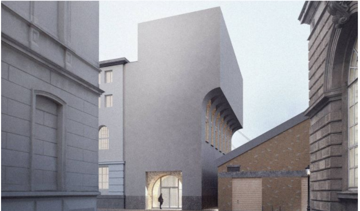
Der geplante Zusatzbau für die Akademieverwaltung

Natürlich wurde auch diskutiert, ob der Kalle als dein Rektor überhaupt einen Entwurf vorlegen durfte, ohne dass ein entsprechender Wettbewerb ausgeschrieben wurde. Tatsächlich ist dieses Verfahren nach neuen Erkenntnissen nicht nur rechtlich okay, sondern im Umfeld der Düsseldorfer Kunstakademie nicht ohne Vorbilder. Das ändert aber nichts daran, dass die charmante Wiese vollständig bebaut würde. Immerhin zeigen die Entwürfe, dass die großen Bäume auf ästhetisch interessante Weise in den Bau integriert werden sollen.