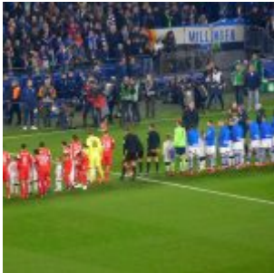
Vor dem Testspiel gegen S04