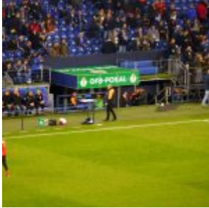
Der Pokal hat...