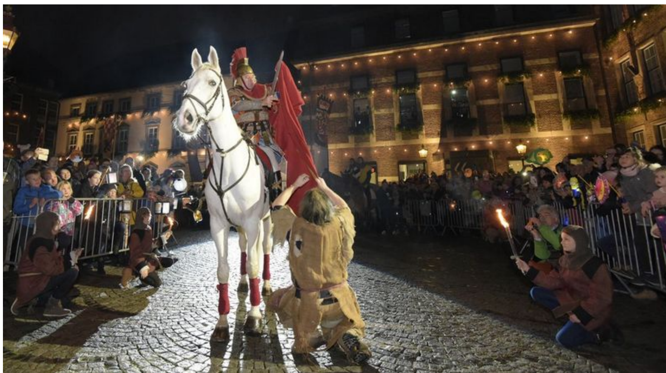
2018: Mantelteilung zu St. Martin vor dem Rathaus

Der Martinstag selbst ist übrigens auch ein Versuch, andere Anlässe, die zum 10. und 11. November gehören, zu übertünchen. Nach dem julianischen Kalender war der 11. November (den klimatischen Bedingungen zu Zeiten von Cäsar entsprechend) Winteranfang. Und damit der Tag, an dem die Bauern den Zehnten zu zahlen hatten, also quasi ihre Pacht. Gleichzeitig nahm dieses Datum auch als Stichtag für Soldzahlungen und das Ende von befristeten Verträgen. Jede Menge heidnische Feste der unterschiedlichsten Kulturen zum Ende der Erntezeit wurden an diesem Tag gefeiert, einige verbunden mit dem Schenken. Die Reichen, die am 11. November ihre Untertanen abkassierten, schenkten gleichzeitig Kleinigkeiten an die Kinder der Armen – wohl um ihre Karmakonten aufzubessern. Die bedankten sich, indem sie den edlen Spendern was vorsangen.