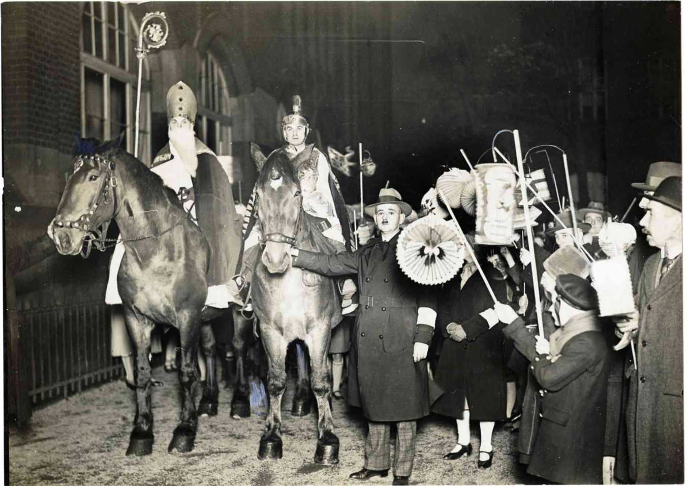
1928: Martinszug auf dem Schulhof der Schule am Hermannplatz

Heiliggesprochen wurde Sankt Martin übrigens nicht deswegen, sondern als sogenannter „Bekenner“. Er war sogar der erste Mensch, der heiliggesprochen wurde, weil er sich unter feindlichen Umständen zum Christentum bekannt hatte; zuvor wurden nur Märtyrer zu Heiligen. Dass er zu einem historisch so frühen Zeitpunkt Christ wurde, führte dazu, dass ein gewisser Sulpicius Severus, bis zu dessen Tod ein Kumpel vom Martin, als Biograph wirkte und eine (vermutlich) heftig geschönte Vita seines Freundes verzapfte. Die besagt, dass dem Martin in der Nacht nach der Mantelteilung Jesus erschienen sei, bekleidet mit dem halben Umhang – offensichtlich als Bezug auf den Spruch aus dem Matthäus-Evangelium „Ich war nackt, und ihr habt mich bekleidet. Was ihr getan habt an einem meiner ärmsten Brüder, habt ihr an mir getan.“