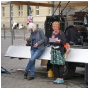
Die Rede zum Fest