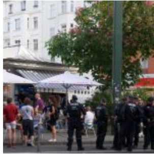
Menschen und Polizisten