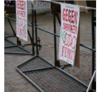
Gegen Sarrazin im Feinstil