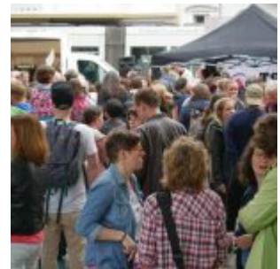
Ein Fest der Nachbarn