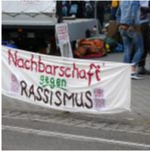
Nachbarschaft gegen Rassismus