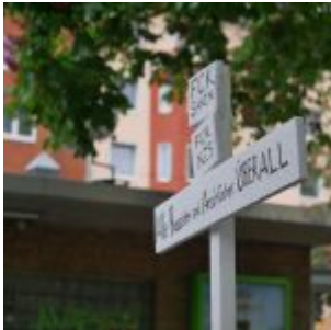
Rassisten sind Arschlöcher