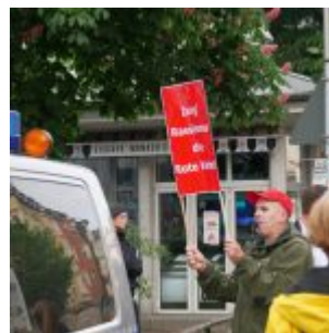
Rote Karte für Rassisten