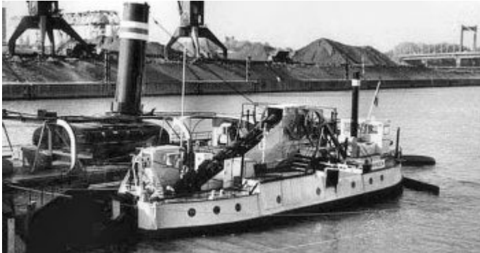
Die Minden liegt neben der Oscar Huber

Und warum konnte sich dieser Eimerkettenbagger solange halten? Ganz einfach: Der Dampfantrieb erwies sich als ideal für die Bedingungen am Grund der Weser, wo nicht – wie am Rhein in unserer Region – vorwiegend Kies und Sand aus der Fahrrinne zu holen sind, sondern nicht selten härtere Brocken aus einem tonigen Untergrund. Frisst sich ein Eimer fest, hält die Eimerkette abrupt an, ohne dass dies der Dampfmaschine schadet. Die fährt mit einem Ruck wieder an und hebt dabei oft die störenden Brocken aus. Eimerkettenbagger werden im Wasserbau nur noch selten eingesetzt, Saugbagger haben sie auf den Wasserstraßen Europas fast vollständig abgelöst.