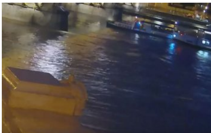
Die schreckliche Kollision auf der Donau (Screenshot)

Als besonders gefährlich gilt die Durchfahrt unter der Margaretenbrücke hindurch. Diese Brücke verbindet die Teile Buda (westlich der Donau) mit Pest (im Osten) und ist insgesamt rund 640 Meter lang. Dabei macht die Brücke einen Knick, weil einer der Hauptpfeiler auf der Südspitze der Margareteninsel steht. Sieben gemauerte Stropfpfeiler tragen die die Stahlbögen mit der Fahrbahn. Daraus ergeben sich je drei Durchfahrten zu den beiden Donauarmen; jeweils eine davon für die jeweilige Fahrrinne berg- und talwärts. Diese Durchfahrten haben eine lichte Weite von rund 60 Metern. Die rechte Rinne ist ausschließlich für stromabwärts fahrende Schiffe vorgesehen. Die linke Fahrrinne wird von stromaufwärts fahrenden Passagier- und Frachtschiffen vorgesehen, darf aber von Ausflugsbooten in beiden Richtungen benutzt werden.