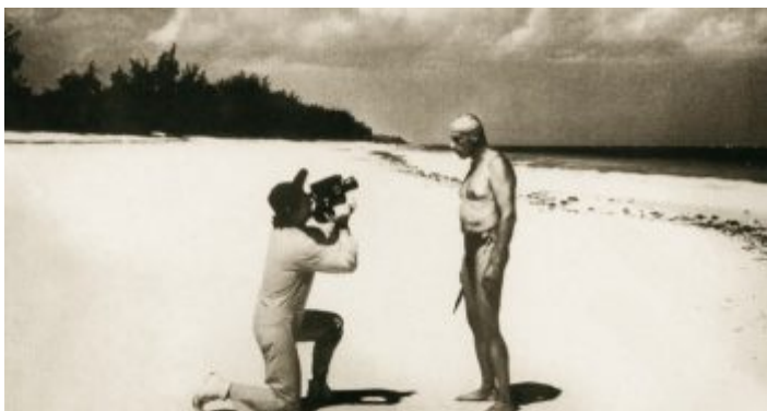
Wilp und Beuys in Kenia

Werbung in Deutschland war nun vor allem Gestaltung und unterschied sich damit spürbar vom Advertising im US-Stil. Dort hatte man ab dem frühen 20. Jahrhundert Dinge der Werbung erfunden, die für uns heute selbstverständlich sind; vor allem die Idee der Marke und die Prozesse der Organisation von Kampagnen. Die schon vor den Fünfzigerjahren gegründeten deutschen Agenturen (ohne US-Partner) arbeiteten nach diesen Prinzipien, aber eine neue Generation Werber wollten etwas anderes, quasi Reklame mit Anspruch. Diese Pioniere gründeten also eigene Agenturen – vor allem mit dem Standort Düsseldorf. Und schon in den frühen Sechzigerjahren wurde die Verzahnung zwischen bildender Kunst, Literatur und Werbung immer enger. Künstler wie Charles Wilp erkannten die Werbung als ideales Spielfeld für ihre Vorstellung von Kunst, der große Bildhauer Joseph Beuys suchte die Nähe der Werber, und die praktische Seite der Gestaltung wurde von den Kreativen der Werkkunstschule befeuert.