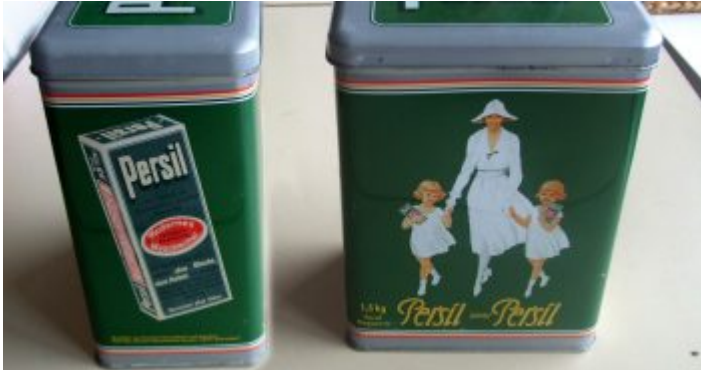
Henkel und Persil als Antreiber der Düsseldorfer Werbewirtschaft

Relativ plötzlich nach dem Ende des ersten Weltkriegs entdeckte die Werbung die Kunst und die Poesie für sich. Nun war Reklame nicht mehr bloß die Abbildung des Produkts. Stattdessen schuf man Bilderwelten rund um die Dinge, die Konsumenten kaufen sollten; jetzt schilderten Texter die Vorzüge einer Marke in gereimten Worten, und alsbald verpflichteten die Werbeabteilungen von Unternehmen und Werbeagenturen Künstler des Wortes und des Bildes. Gerade in Deutschland verfassten (später) renommierte Dichter wie Ringelnatz, Kästner und Tucholski Werbesprüche, und Maler setzten die Produkte malerisch oder zeichnerisch in Szene.