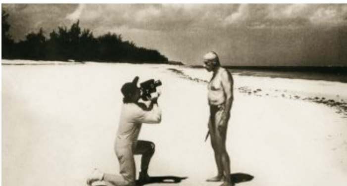
Wilp und Beuys in Kenia

Werbung in Deutschland war nun vor allem Gestaltung und unterschied sich damit spürbar vom Advertising im US-Stil. Dort hatte man ab dem frühen 20. Jahrhundert Dinge der Werbung erfunden, die für uns heute selbstverständlich sind; vor allem die Idee der Marke und die Prozesse der Organisation von Kampagnen. Die schon vor den Fünfzigerjahren gegründeten deutschen Agenturen (ohne US-Partner) arbeiteten nach diesen Prinzipien, aber eine neue Generation Werber wollten etwas anderes, quasi Reklame mit Anspruch. Diese Pioniere gründeten also eigene Agenturen – vor allem mit dem Standort Düsseldorf. Und schon in den frühen Sechzigerjahren wurde die Verzahnung zwischen bildender Kunst, Literatur und Werbung immer enger. Künstler wie Charles Wilp erkannten die Werbung als ideales Spielfeld für ihre Vorstellung von Kunst, der große Bildhauer Joseph Beuys suchte die Nähe der Werber, und die praktische Seite der Gestaltung wurde von den Kreativen der Werkkunstschule befeuert.