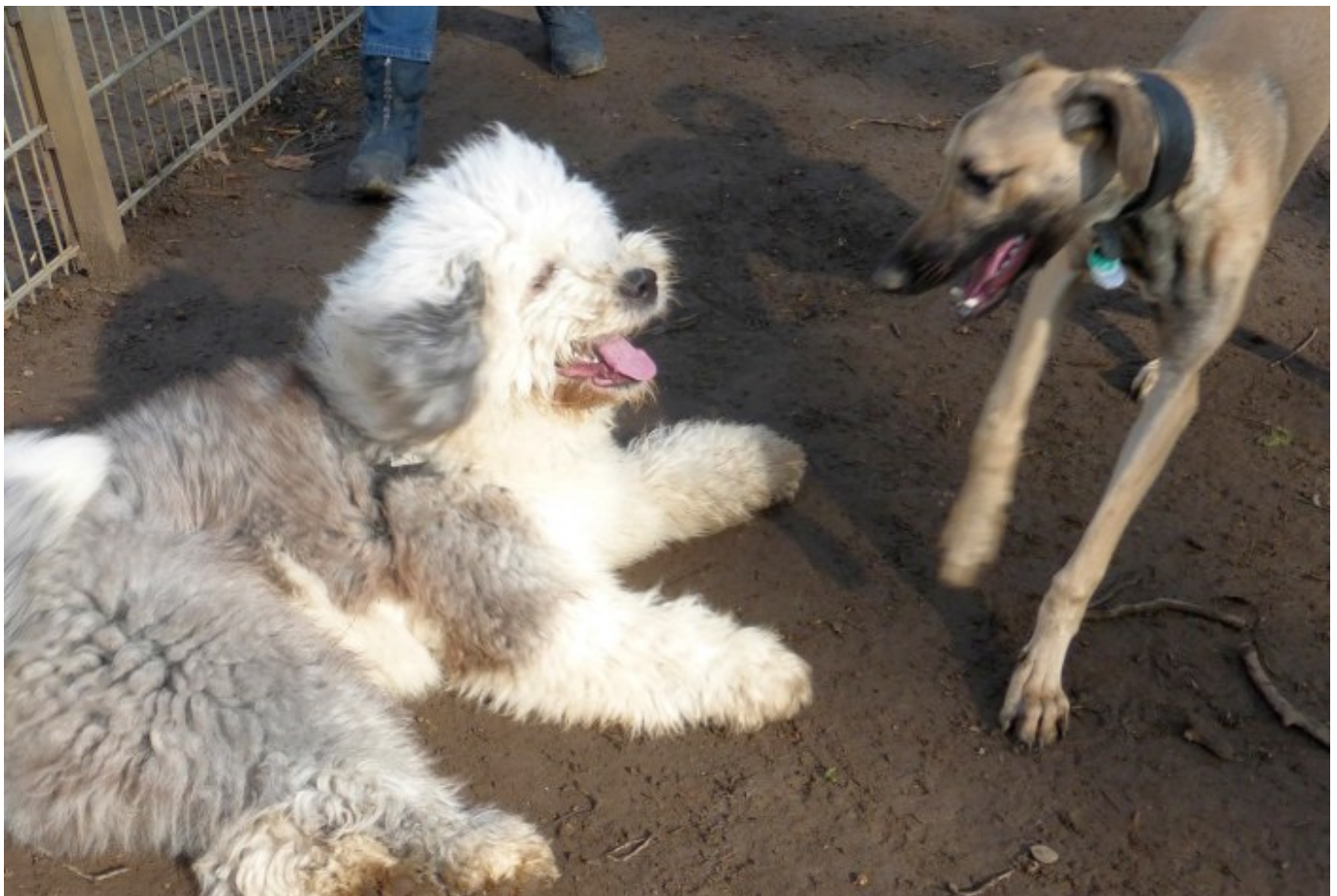
Junge Hunde raufen gern

Übereinstimmung mit der zuständigen Verhaltensforschung ergeben, dass solch ein Hund in der Lage ist, zwei voneinander unabhängige Sätze an Verhaltensweise auszubilden: einen für den Umgang mit den Menschen, einen für den Umgang mit Artgenossen. Wer also immer noch meint, ein Mensch könne „Rudelführer“ sein, irrt. Für den Hund ist der Mensch ein Mensch. Das hat sich in mindestens 12.000 Jahren Ko-Evolution in die Gene des Haushundes eingepreßt. Und weil dieser Haushund kollektiv über mehrere Hundert Generationen „gelernt“ hat, dass er über alles gesehen vom Menschen profitiert, wird er mehr oder weniger intensiv versuchen, „seinen“ Menschen zu gefallen und seinen rassespezifischen Dienst zu verrichten.