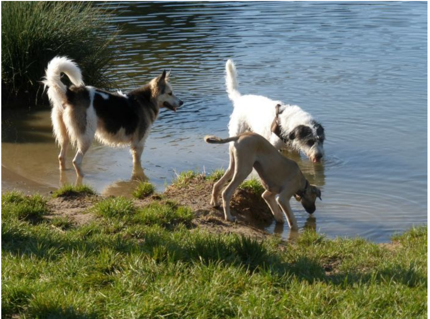
Das korrekte Verhalten gegenüber erwachsenen Hunden muss die Welpen lernen

Ja, als Windhundhalter, der auf straffreie und belohnungsarmen Umgang mit den dünnen Rennern setzt, rede ich immer von „Ausbildung“ und nicht von „Erziehung“, denn das ist Begriff, der ganz grundsätzlich nicht zum Miteinander von Mensch und Hund passt. Was also muss die Welpen eigentlich lernen? Thema Nummer 1 heißt: „Sicherheit“. Gerade in der Stadt, in der die Gefahr für Leib und Leben der Fellnasen vom Straßenverkehr ausgeht, muss der Hund führbar sein – dazu später mehr. Thema Nummer 2 lautet: Sozialverhalten. Unser Hundchen muss lernen sich den anderen Familienmitgliedern, Besuchern, fremden Menschen, anderen Hunden und anderen Haus- und Nutztieren gegenüber angemessen zu verhalten.