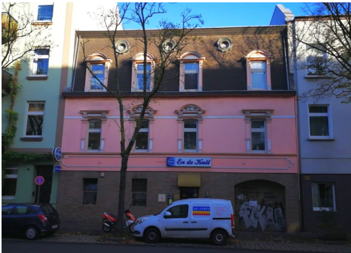
En de Kull, Oberbilker Allee

Zwischendurch war wieder einmal die Bahn am Zug, den wegen der neuen Bahnsteige des S-Bahnhofs Volksgarten wurde der Bahndamm wieder verbreitert, sodass die Hälfte der Stehplätze auf der Gegengerade wegfielen. Und nun fürchten die Freund:innen der Turn- und Rasensportunion wieder die Bahn, denn eine weitere Verbreiterung im Zuge des RRX-Projektes steht ins Haus. Welche Folgen das für das Stadion haben wird, ist noch offen.