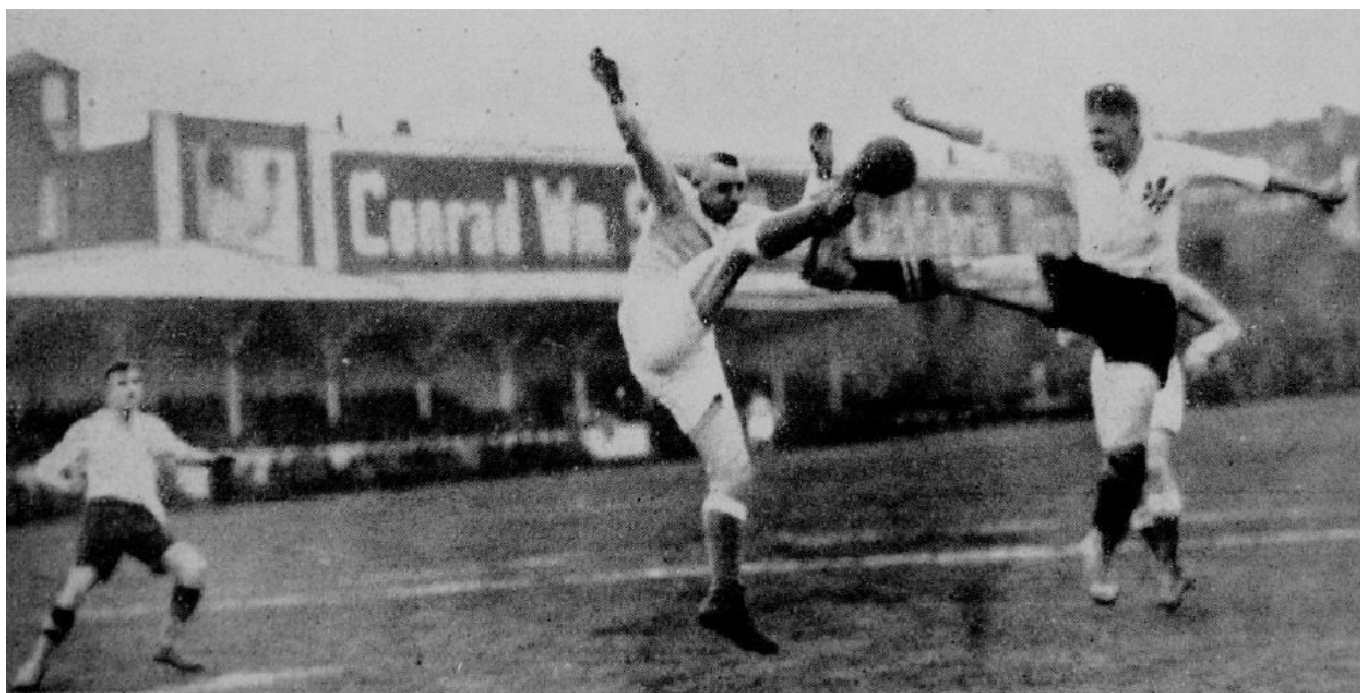
Spielszene aus dem Spiel der TuRU gegen SW Barmen 1926. Im Hintergrund die alte Holztribüne im Stadion an der Oberbilker Allee

Dass die TuRU mehr Fläche brauchte, wurde nach der Fusion schnell klar, denn auf dem Platz an der Oberbilker Allee wurde nicht nur Fußball gespielt, sondern auch Feldhandball und Feldhockey. Außerdem knapste die Reichsbahn dem Verein durch die Verbreiterung des Bahndamms um zwei Gleise etliche Meter Fläche ab. So wurde 1934 aus dem ehemaligen VfR- und TuRU-Trainingsplatz das TuRU-Stadion. Bis weit in die Fünfzigerjahre hinein blieb der ehemalige TuRU-Platz Trainingsgelände. Nach der Bahndammverbreiterung wurde allerdings die Leersenstraße aufgegeben; nun führte ein schmaler Weg direkt unterhalb der Gleise von der Oberbilker Allee bis zum Nebeneingang des Stadions (ungefähr da, wo heute der LIDL-Markt steht).