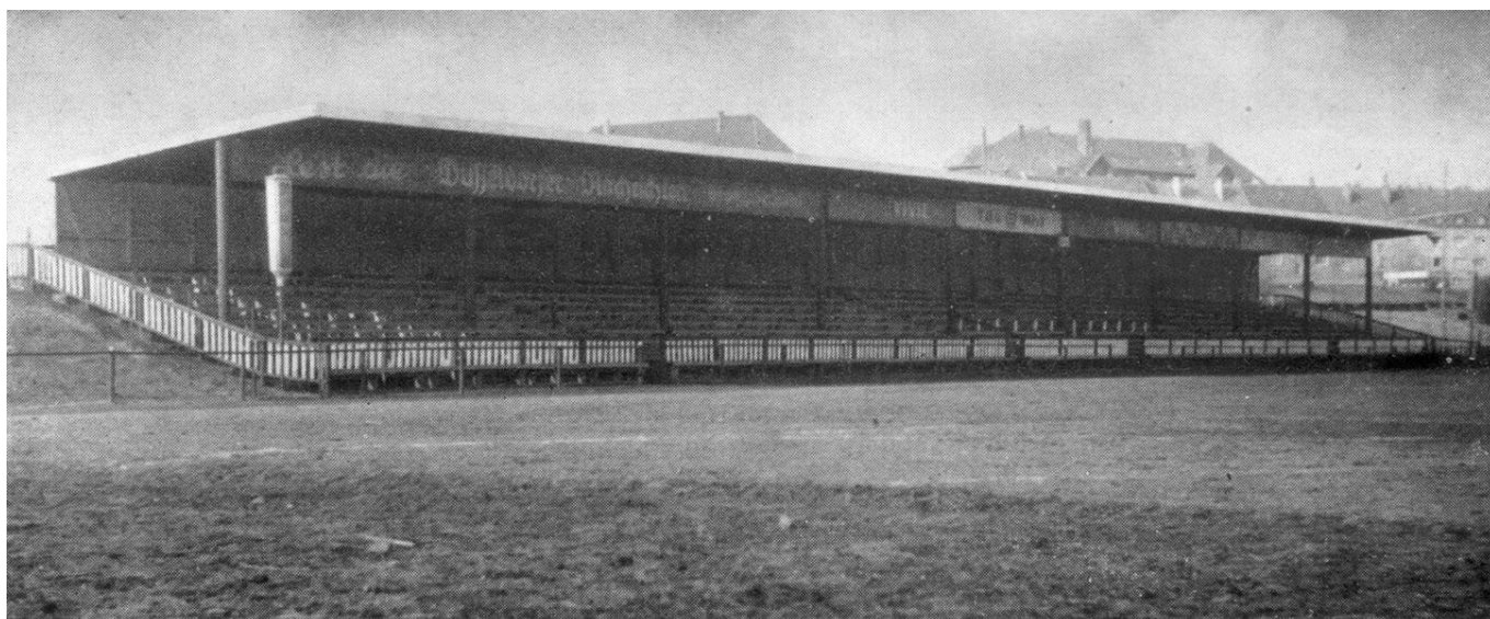
Die alte Holztribüne (Foto aus 1954: TuRU-Festschrift)

Erst Mitte der Sechzigerjahre entstand das Vereinsgebäude mit den Büros und vor allem den Kabinen und Waschräumen für die Spieler. Bis dahin zogen sich die Kicker wie seit 1906 immer in der Gaststätte En de Kull oder im Remscheider Hof um. Unter dem verstorbenen OB Erwin floss im Rahmen des „Masterplans Sport“ eine Menge Geld in die Bezirkssportanlagen, von dem auch der TuRU-Platz profitierte. Unter anderem wurden die Nebenplätze, auf denen 30 Jahre alte, rote Asche lag, modernisiert. Platz 2 bekam einen modernen Kunstrasen, Platz 3 wurde in einen zweiten Rasenplatz umgewandelt.