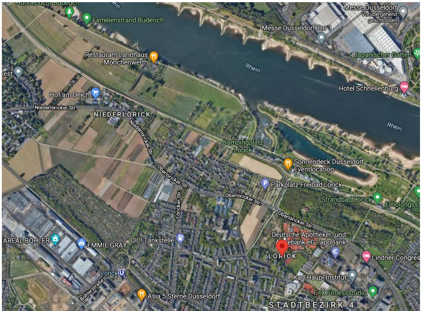
Um diese Gegend geht es bei der U81 im Linksrheinischen

Bleibt die Frage der Kosten. Momentan geht die Tunnelfraktion davon aus, dass ihre Lösung nur 60 Millionen Euro teurer wäre als eine Brücke, für die immerhin auch schon rund 220 Millionen Euro angesetzt werden. Experten halten Baukosten deutlich jenseits der 300 Millionen Euro für eine Röhre für wahrscheinlicher.