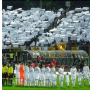
Kapitulieren die schon?