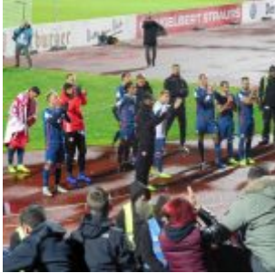
Spieler und Fans feiern

In Zeiten, in denen sich Sky-Kommentatoren öffentlich ekeln, weil ein Spieler auf den Rasen rotzt, und andere TV-Sprechpuppen beim Anblick einer Kerze im Ulmer Münster die Anti-Pyro-Phrasendreschmaschine anwerfen, muss man sich als Freund des Fußballs und der ihn umgebenden Kultur über Partien wie das Pokalspiel der glorreichen Fortuna beim traditionsreichen Schwimm- und Sportverein im ebenfalls geschichtsumwitterten Donaustadion schon mal grundsätzlich freuen. Denn das ist Fußball, weil Fußball ist auf dem Platz und nicht in irgendwelchen Fernsehstudios, wo ahnungslose Moderatoren sich von eitlen und/oder dummen „Experten“ den unglaublichsten Blödsinn aufquatschen lassen. Wenn die Meldung des ersten Tages der zweiten DFB-Pokalrunde sich um die Verletzung irgendeines FCB-Söldners dreht und die Begegnung des Projekts aus Markrandstädt gegen das Dietmar-Hopp-Gedächtnis-Team zum Knüller des zweiten Tages hochgejazzt wird, stimmt etwas – ganz im Sinne von Rummenigge und Hoeneß – mit dem medialen Krach rund um diesen herrlichen Ballsport nicht. Das als Vorrede zu einem freudigen Ereignis, das am Ende mit 5:1 für F95 gewertet wurde.