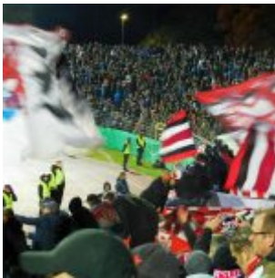
Ulm 2019: Der Kapo am Rohr