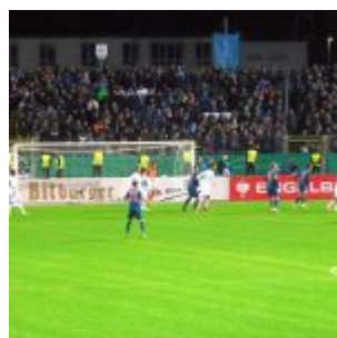
Fast das sechste Tor