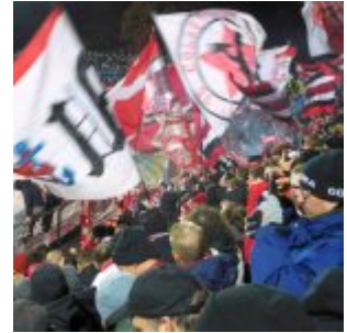
Oktober 2018: Fröhliche Fortuna- Fahnen im eiskalten Ulm