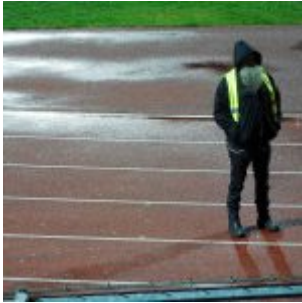
Auch Zwerge frieren