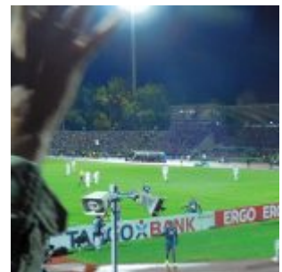
Torjubel mit Dodi Lukebakio im Oktober 2018