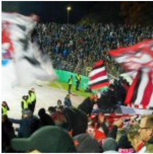
Ulm 2019: Der Kapo am Rohr