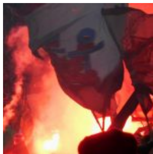
Herzerwärmende Pyro