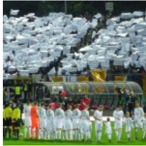
Kapitulieren die schon?