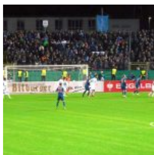
Fast das sechste Tor