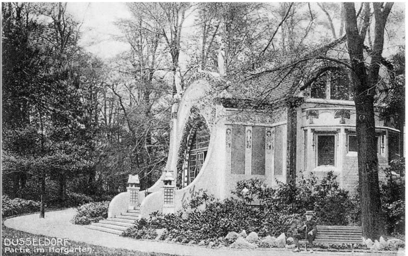
Ein anderer Blick auf den Milchpavillon im Majolikahäuschen

Standort Düsseldorf in dieser Zeit des industriellen Aufbruchs konkurrenzfähig halten wollten. So entstand zwischen 1886 und 1896 der Hafen auf der Lausward. Von 1898 bis 1902 wurde an der Rheinufervorverlegung gearbeitet; das untere Rheinwerft, das zum Hafen zählte, und die Rheinuferpromenade entstanden. Und dann war da noch die Golzheimer Insel, eine sandige, sumpfige Landzunge, die schon bei geringem Hochwasser überflutet wurde und zu nichts nütze war. Genau dieses Terrain zwischen der Westspitze des Hofgartens und dem Teil, an dem sich heute die Theodor-Heuss-Brücke steht, hatten sich die Macher für die „kleine Weltausstellung“ ausgesucht.