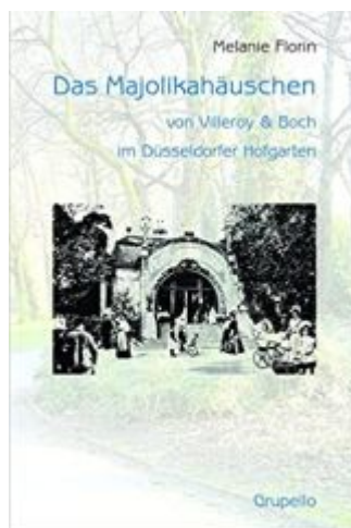
Die wunderbare Monografie zum Majolikahäuschen

und dem 20. Oktober 1902 zählte man sage-und-schreibe mehr als fünf Millionen Besucher, mehr als die Hälfte davon aus dem Ausland – sogar Delegationen aus Übersee, zum Beispiel auch aus Japan konnte man begrüßen und ihnen die Innovations- und Wirtschaftskraft Deutschlands präsentieren. In diesem großen Rahmen war der Majolikapavillon der Firma Villeroy & Boch, zumal am äußersten Rand des Geländes gelegen, nur eine winzige Fußnote.