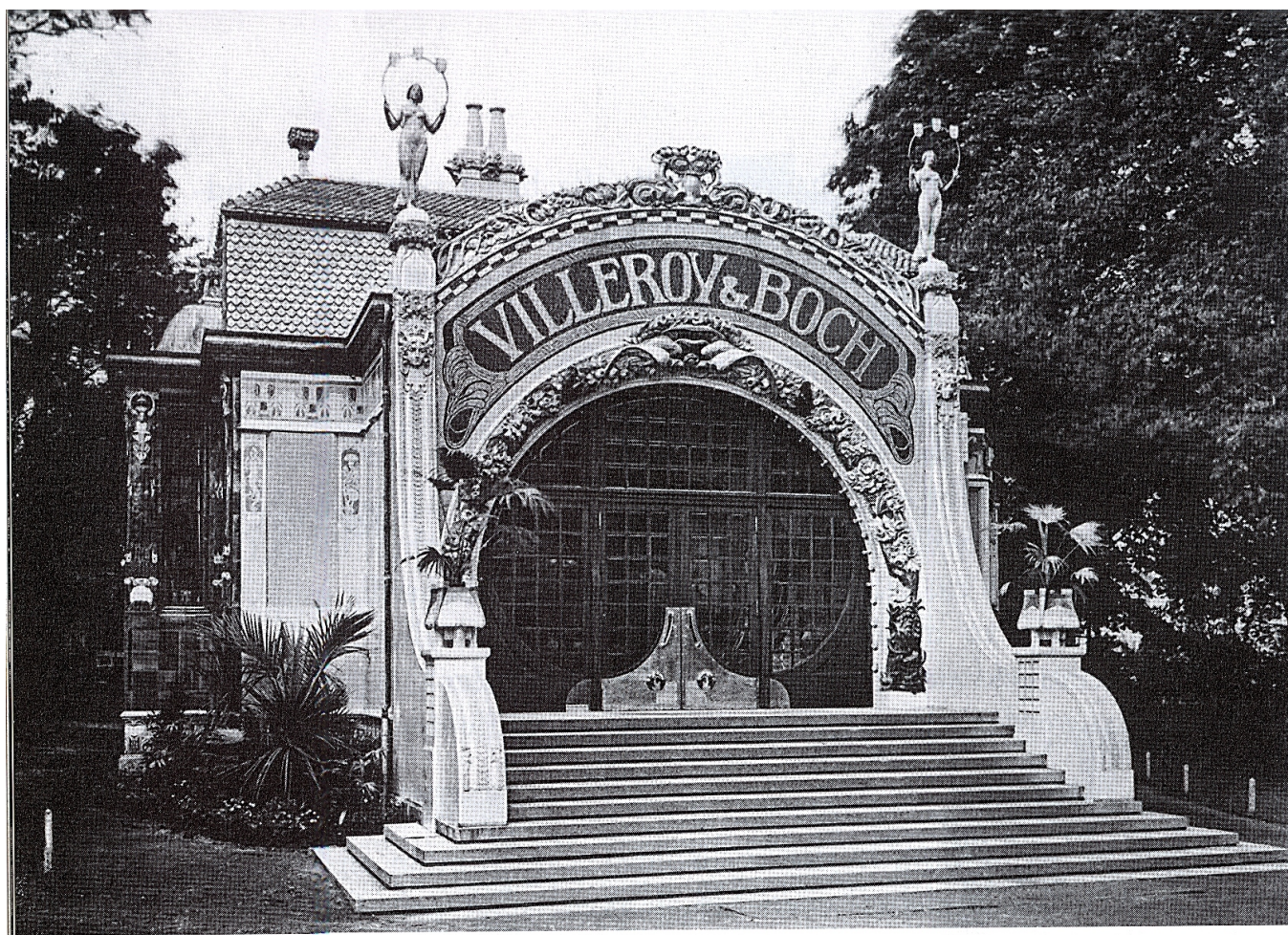
Das Majolikahäuschen während der Industrie- und Gewerbeausstellung von 1902