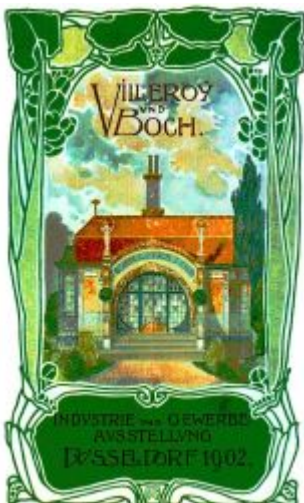
Titelbild der Broschüre von Villeroy & Boch zum Majolikahäuschen

Bericht · Fast ganz aus dem öffentlichen Gedächtnis verschwunden ist eine gastronomische Einrichtung, die nicht lange bestand und ein unrühmliches Ende nahm: das Majolikahäuschen im Hofgarten. Wobei dieses mit bemalter und glasierter Keramik geschmückte Gebäude erst nach der Industrie- und Gewerbeausstellung Düsseldorf von 1902 umgewidmet wurde – zunächst als Milchpavillon, später für kurze Zeit als Gartencafé. Denn ursprünglich wurde der kleine (13,5 mal 11,5 Meter groß) Jugendstilbau als Ausstellungspavillon der Firma Villeroy & Boch errichtet. Außen sollte die Fassade die Möglichkeiten von Keramik-Kacheln, -Fliesen und -Reliefs als Bauschmuck zeigen, innen präsentierte der Hersteller seine ganze Palette an Geschirr. Der Name lehnte sich an das berühmte Majolikahaus in Wien an, dessen geflieste Fassade Ende des 19. Jahrhunderts als Beispiel für hygienisches Bauen galt. [Lesezeit ca. 6 min]