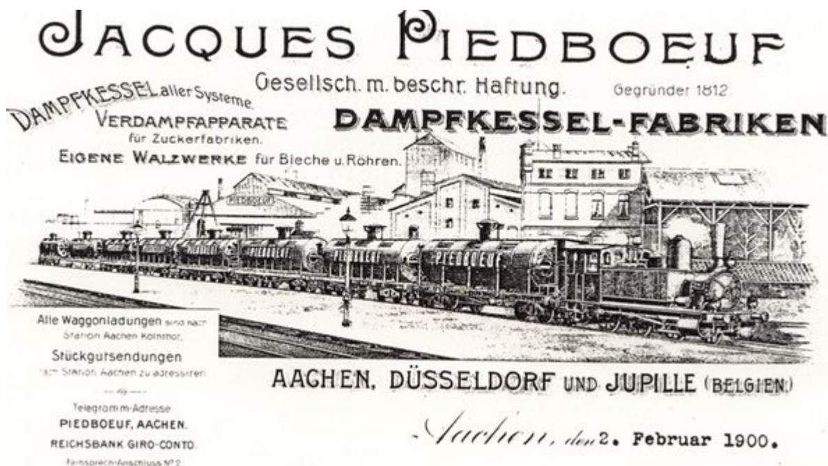
Reklamepostkarte von 1900 für die Piedboeuf-Unternehmen

sich nicht schlüssig klären. Denn die Entwicklung der Schwerindustrie in Düsseldorf verlief ab etwa 1850 durchaus chaotisch. Man muss es sich so vorstellen, dass jenseits der heutigen Innenstadt inklusive der „modernen“ Stadterweiterungen nach Süden und Norden Mitte des 19. Jahrhunderts vor allem landwirtschaftliche Fläche zu sehen waren mit den späteren Stadtteilen als Dörfern mittendrin. Grund und Boden war billig zu haben, und mit gleich zwei wichtigen Eisenbahntrassen, die durch die Region führten, sowie dem Rhein als Transportweg bot es sich an, Fabriken der rasant aufsteigenden Eisen- und Stahlindustrie bei Düsseldorf zu errichten.