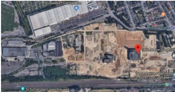
Google-Map: Das Gelände der Gerresheimer Glashütte heute