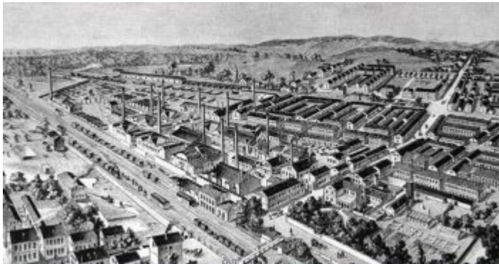
Schaubild der Glashütte 1892

zählte auch die Glashütte Schauenstein im niedersächsischen Obernkirchen, die 1799 gegründet worden war. Was immer den jungen Ferdinand daran fasziniert haben mag: Im Jahr 1864 ließ er sich sein Erbe von 30.000 Talern auszahlen und gründete die Gerresheimer Glashütte.