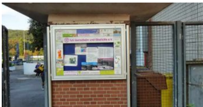
Das Gerrix-G am Eingang zur Anlage des TuS Gerresheim