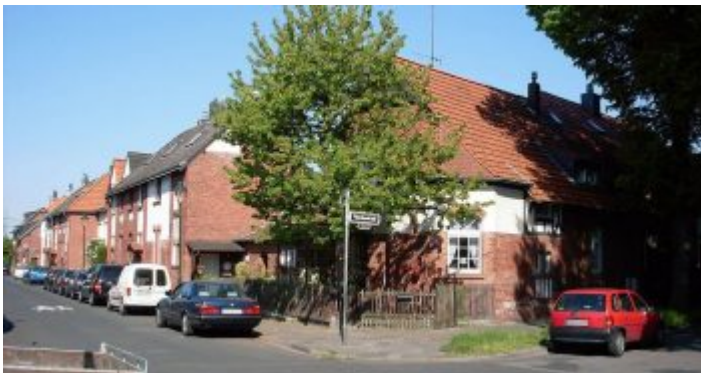
Die denkmalgeschützte Meistersiedlung jenseits der Bahnlinie

Überhaupt steht die Gerresheimer Glashütte für den Übergang von der handwerklichen zur industriellen Flaschenherstellung. Kaum noch vorstellbar, dass 88 Glasmacher im Jahr 1865 allein mit Lungenkraft 800.000 Flaschen produzieren konnten! Dabei war die Kapazität vor allem durch die traditionellen Häfen (= Schmelzöfen) und die Anzahl der blasenden Glasmacher begrenzt. Die Erfindung des Wannenofens und seine Weiterentwicklung zum kontinuierlichen Schmelzofen durch Friedrich Siemens, bei dem die Schmelze nicht mehr einzeln und pro Tag oder Schicht erzeugt wurde, brachte eine drastische Erhöhung der Produktion möglich, weil einfach mehr Glasmacher mit dem Ausgangsstoff versorgt werden können. Man stelle sich vor, dass in der damals größten Glashütte der Welt im Jahr 1902 mehr als 150 Millionen Flaschen auf traditionelle Weise hergestellt wurden – von rund 5.300 Arbeitern.