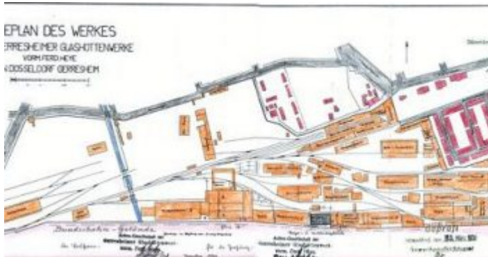
Lageplan der Glashütte von 1951