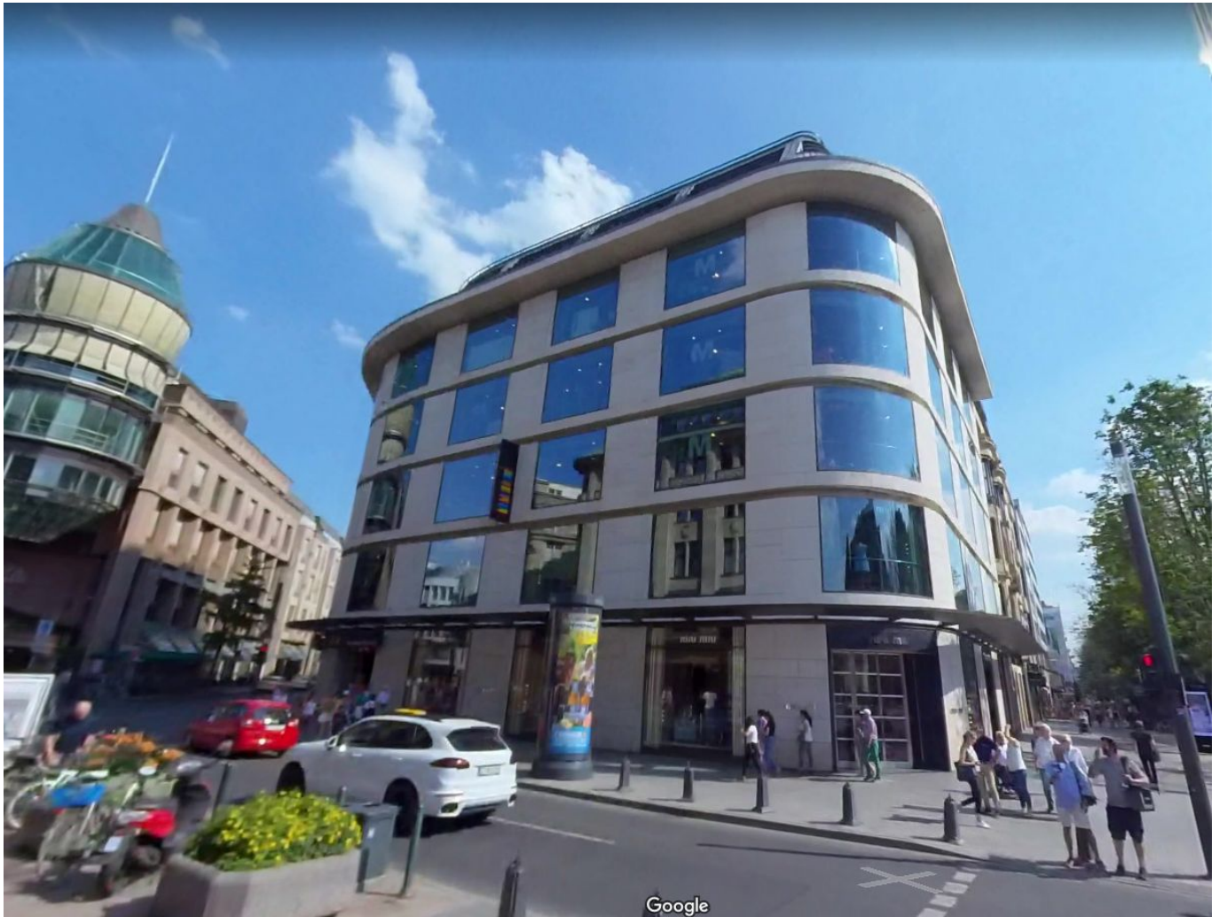
Und so sieht der Komplex heute aus

Stadtplaners Tamms begann eine erste Welle der Grundstücksspekulation im Umfeld der Königsallee.