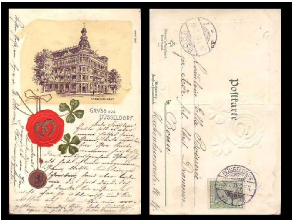
Diese Postkarte von 1901 zeigt das Cornelius-Haus

Nach dem Ende der Gründerkrise um 1895 herum brachte die fortschreitende Industrialisierung eine neue Phase wirtschaftlichen Wachstums hervor. Auch und besonders in Düsseldorf, das ohnehin wenig unter dem wirtschaftlichen Abschwung nach 1876 gelitten hatte. Die Einwohnerzahl stieg gleichmäßig, immer mehr Fabriken entstanden. Das führte zu wachsendem Wohlstand im Bürgertum. Und schon damals wollten es die wohlhabenden Bürger gern schön haben. Die Stadt stand im Zeichen der Verschönerung, die etliche aufregende Bauwerke mit sich brachte. Hinzu kam eine explosionsartige Ausweitung und eine grundlegende Veränderung der Gastronomie. Das Arabische Café an der Graf-Adolf-Straße war ein Vertreter dieser Art und eben das Cornelius-Haus an der Blumen-/Schadowstraße/Kö.