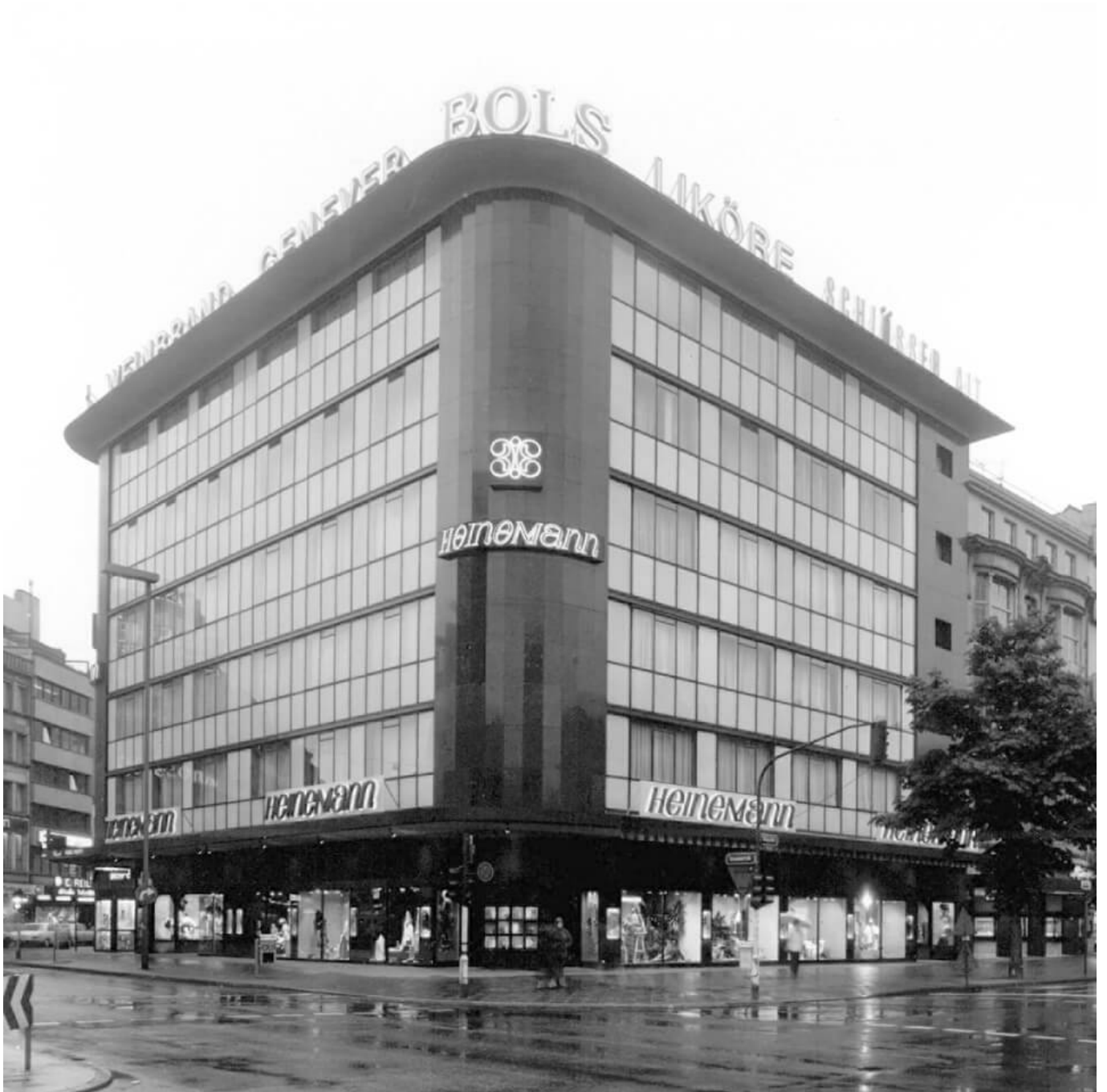
50 Jahre lang stand hier das Modehaus Heineemann

Im Ersten Weltkrieg wurde das Angebot stark eingeschränkt, aus einem der beiden Restaurants wurde eine Bierhalle, die Galerie blieb geschlossen. Nach Kriegsende kam das Cornelius-Haus nie wieder so richtig in Schwung. Den Zweiten Weltkrieg überstand der Häuserblock fast unbeschädigt. Aber im Zuge des Stadtumbaus unter der Ägide des NS-