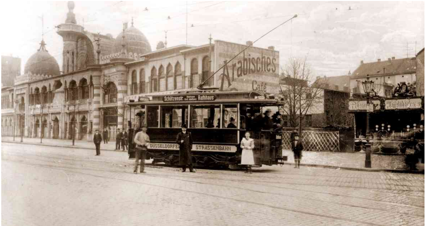
Eine Straßenbahn vor dem Arabischen Café