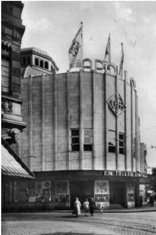
So sah das Apollo-Theater nach der Radikalsanierung 1931 aus

Im Zuge des Ersten Weltkriegs blieb der Erfolg aus, die AG wurde aufgelöst, das Gebäude fiel an die Stadt. Von 1921 bis 1925 war im Apollo das Stadttheater untergebracht, und 1931 wurde das Haus zum damals größten Kino Deutschlands umgebaut und erlebte zahllose Filmpremieren. Dabei unterzog man das Bauwerk einer radikalen Umgestaltung der Fassade. Lediglich die „runde Ecke“ blieb erhalten, der neo-romantische Zierrat wurde gnadenlos durch glatten Kunststein ersetzt. Auch die Kuppel fiel dieser Brutalsanierung zum Opfer – eine Zwischendecke wurde eingezogen. Im September 1940 traf eine Brandbombe das Apollo-Theater, das vollständig ausbrannte.