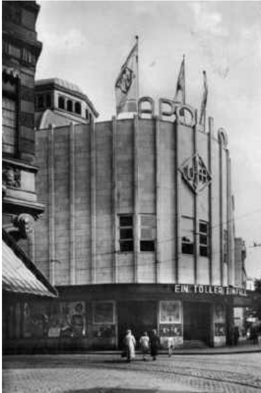
So sah das Apollo-Theater nach der Radikalsanierung 1931 aus

Im Zuge des Ersten Weltkriegs blieb der Erfolg aus, die AG wurde aufgelöst, das Gebäude fiel an die Stadt. Von 1921 bis 1925 war im Apollo das Stadttheater untergebracht, und 1931 wurde das Haus zum damals größten Kino Deutschlands umgebaut und erlebte zahlreiche Filmpremieren. Dabei unterzog man das Bauwerk einer radikalen Umgestaltung der Fassade. Lediglich die „runde Ecke“ blieb erhalten, der neo-romantische Zierrat wurde gnadenlos durch glatten Kunststein ersetzt. Auch die Kuppel fiel dieser Brutalsanierung zum Opfer – eine Zwischendecke wurde eingezogen. Im September 1940 traf eine Brandbombe das Apollo-Theater, das vollständig ausbrannte.