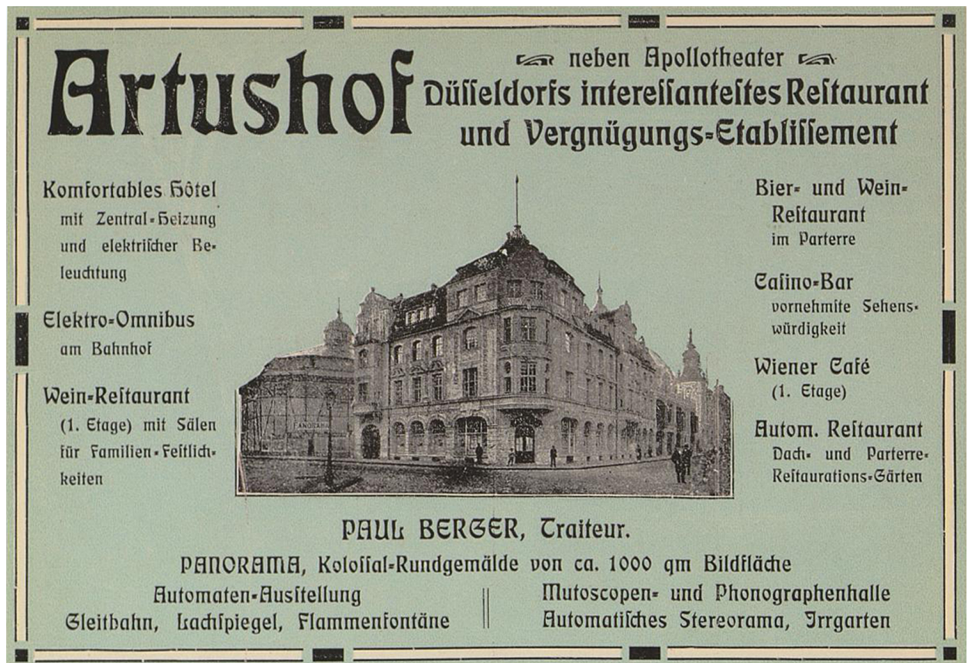
Treffpunkt der Künstler, der Reichen und der Schönen – der Artushof neben dem Apollo

Apollo noch selbst kennen – unter anderem bei einer Weihnachtsgala im Jahr 1957, die einen nachhaltigen Eindruck hinterließ. Mit dem Niedergang der Lichtspielhäuser blieb auch der Erfolg im Apollo-Theater aus. 1959 schloss es für immer die Türen, und 1966 wurde es abgerissen.