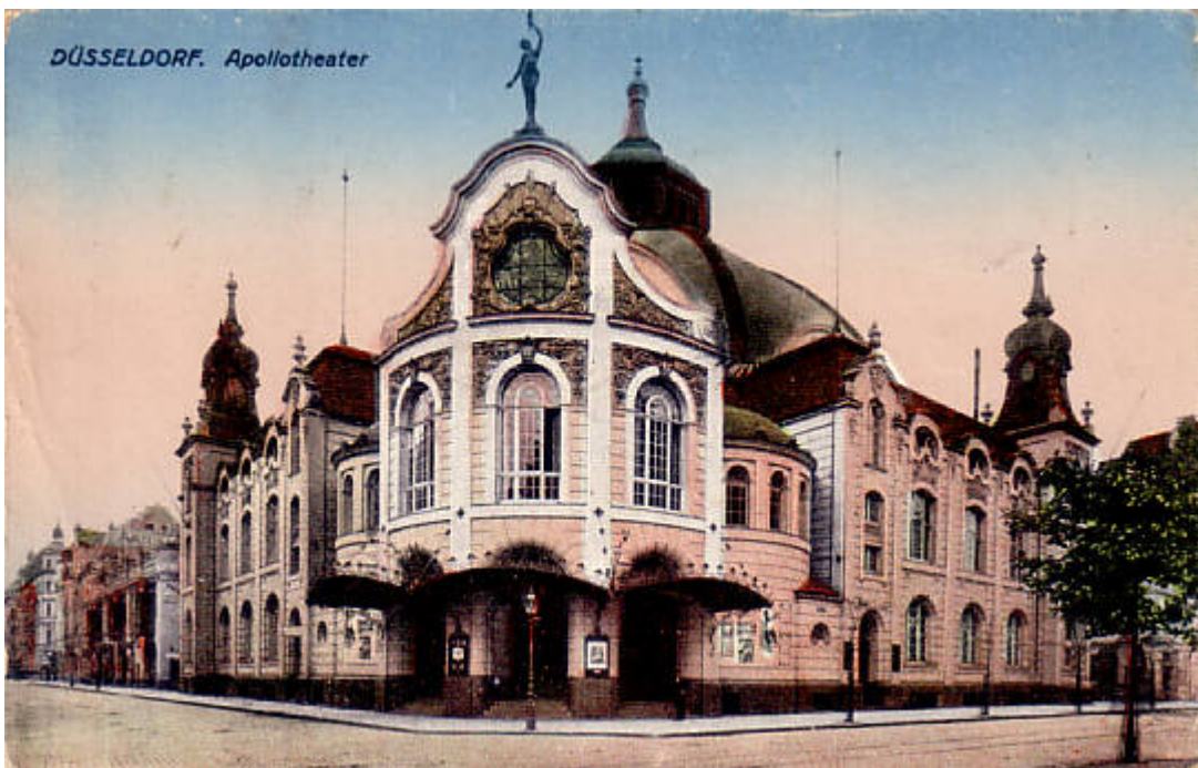
Das Apollo-Theater auf einer zeitgenössischen Postkarte