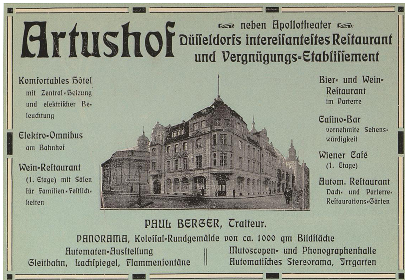
Treffpunkt der Künstler, der Reichen und der Schönen – der Artushof neben dem Apollo

Apollo noch selbst kennen – unter anderem bei einer Weihnachtsgala im Jahr 1957, die einen nachhaltigen Eindruck hinterließ. Mit dem Niedergang der Lichtspielhäuser blieb auch der Erfolg im Apollo-Theater aus. 1959 schloss es für immer die Türen, und 1966 wurde es abgerissen.