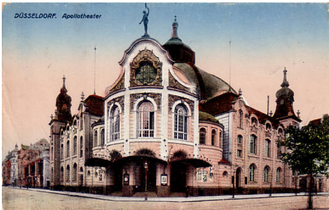
Das Apollo-Theater auf einer zeitgenössischen Postkarte