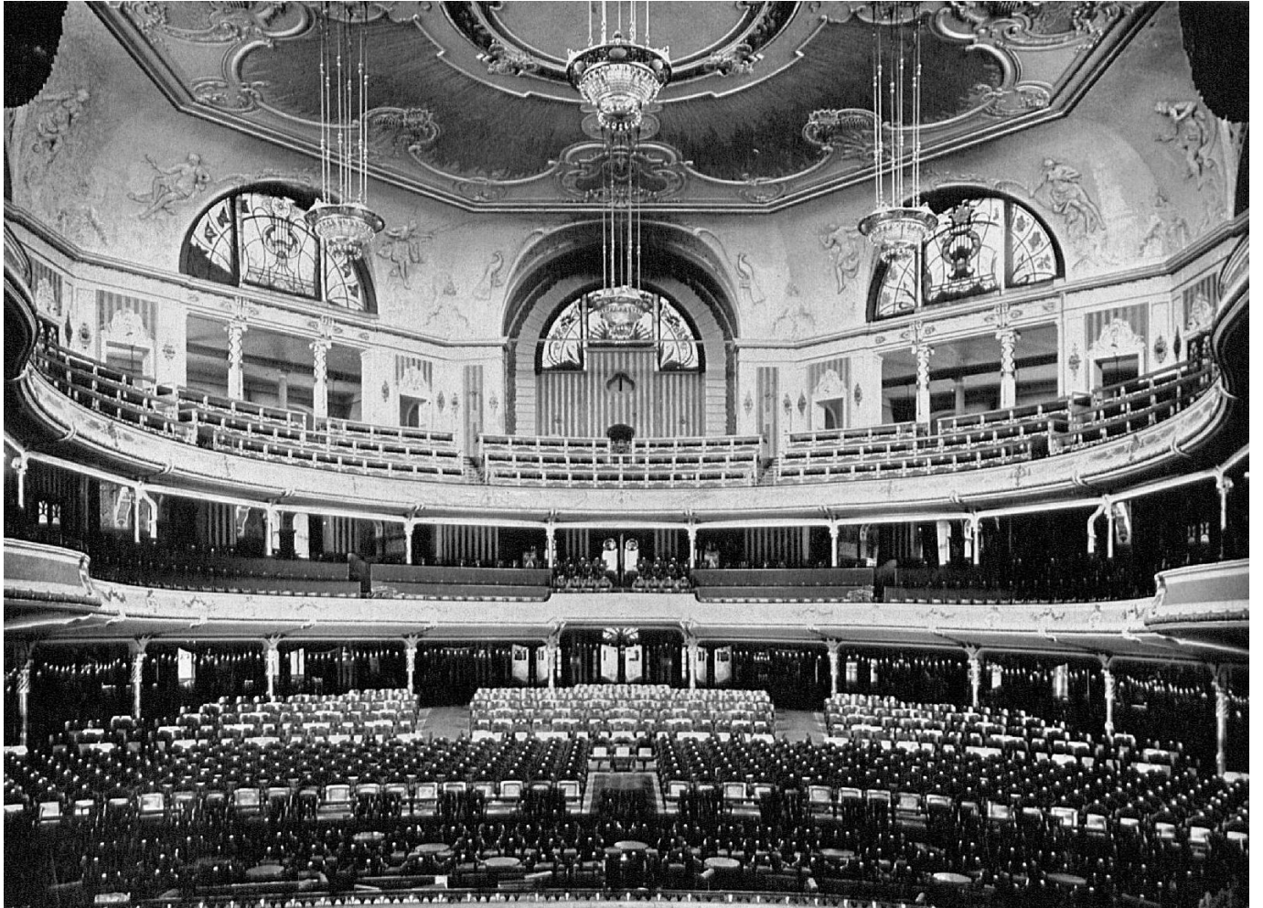
So sah der Kuppelsaal im Apollo-Theater aus