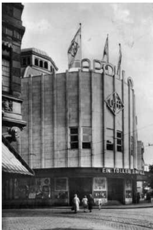
So sah das Apollo-Theater nach der Radikalsanierung 1931 aus

Im Zuge des Ersten Weltkriegs blieb der Erfolg aus, die AG wurde aufgelöst, das Gebäude fiel an die Stadt. Von 1921 bis 1925 war im Apollo das Stadttheater untergebracht, und 1931 wurde das Haus zum damals größten Kino Deutschlands umgebaut und erlebte zahllose Filmpremieren. Dabei unterzog man das Bauwerk einer radikalen Umgestaltung der Fassade. Lediglich die „runde Ecke“ blieb erhalten, der neo-romantische Zierrat wurde gnadenlos durch glatten Kunststein ersetzt. Auch die Kuppel fiel dieser Brutalsanierung zum Opfer – eine Zwischendecke wurde eingezogen. Im September 1940 traf eine Brandbombe das Apollo-Theater, das vollständig ausbrannte.