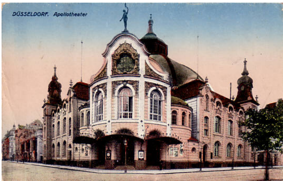
Das Apollo-Theater auf einer zeitgenössischen Postkarte