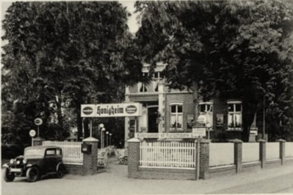
Kaffee-Restaurant Villa Honigheim Düsseldorf