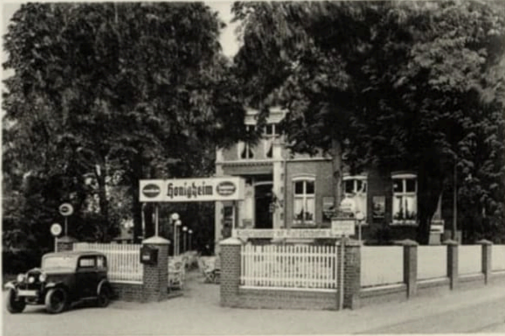
Kaffee-Restaurant Villa Honigheim Düsseldorf