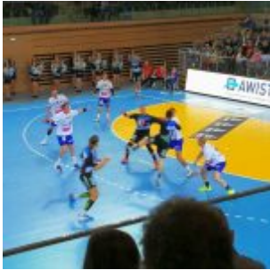
Vikings vs Eisenach 27:32 – Leider erfolglos