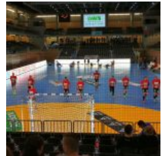
Aufwärmen im Castello