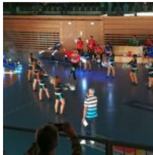
HC Rhein Vikings: Einlauf der Spieler