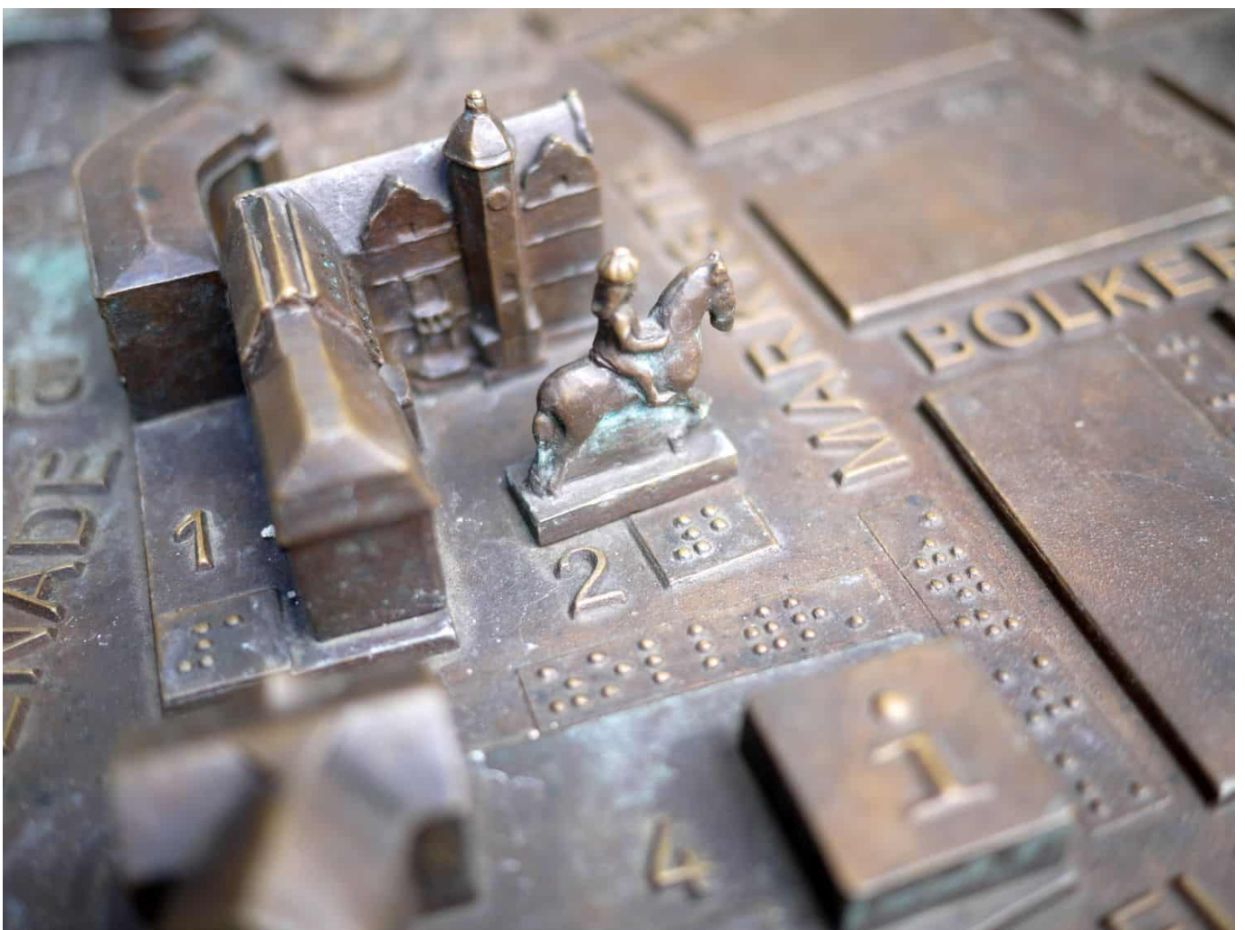
Bronzemodell der Altstadt am Rathaus

Konrad Adenauer singe Heimatstadt partout zur Millionenmetropole machen wollte, hat man alle Landgemeinden und Kleinstädte im Umfeld, die sich nicht rechtzeitig gewehrt haben, eingemeindet. Deshalb weiß keiner so genau, wo dieses Cologne anfängt und aufhört. Blöderweise hat Düsseldorf das teilweise nachgemacht und sich eine über die Jahrhunderte selbständige Gemeinde wie Angermund einverleibt. Und, ja, man war auch mal an Monheim dran.