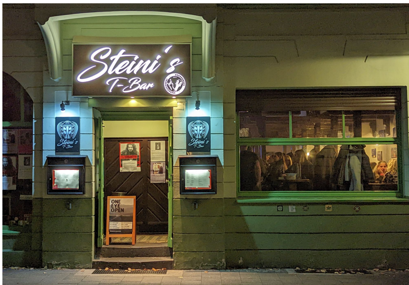
Steini's T-Bar am Kölner Tor in Gerresheim

Das liegt mit Sicherheit daran, dass alles, was wichtig und interessant ist, in einem Umkreis von kaum zweieinhalb Kilometern angesiedelt ist – selbst der Flughafen ist nur 5,5 Kilometer Luftlinie von der Altstadt entfernt. Man muss nicht besonders gut zu Fuß sein, um per pedes vom Hauptbahnhof zum Ehrenhof zu kommen oder die Innenstadt von Friedrichstadt bis Pempelfort zu durchqueren. Alle wichtigen Museen liegen nie mehr als fünf(!) Fahrradminuten auseinander.