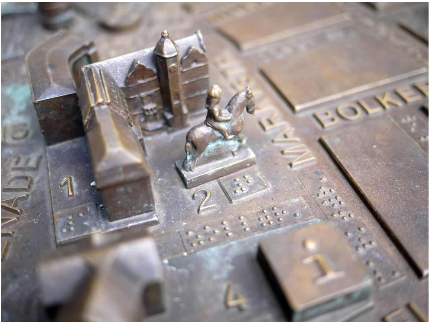
Bronzemodell der Altstadt am Rathaus

Konrad Adenauer singe Heimatstadt partout zur Millionenmetropole machen wollte, hat man alle Landgemeinden und Kleinstädte im Umfeld, die sich nicht rechtzeitig gewehrt haben, eingemeindet. Deshalb weiß keiner so genau, wo dieses Cologne anfängt und aufhört. Blöderweise hat Düsseldorf das teilweise nachgemacht und sich eine über die Jahrhunderte selbständige Gemeinde wie Angermund einverleibt. Und, ja, man war auch mal an Monheim dran.