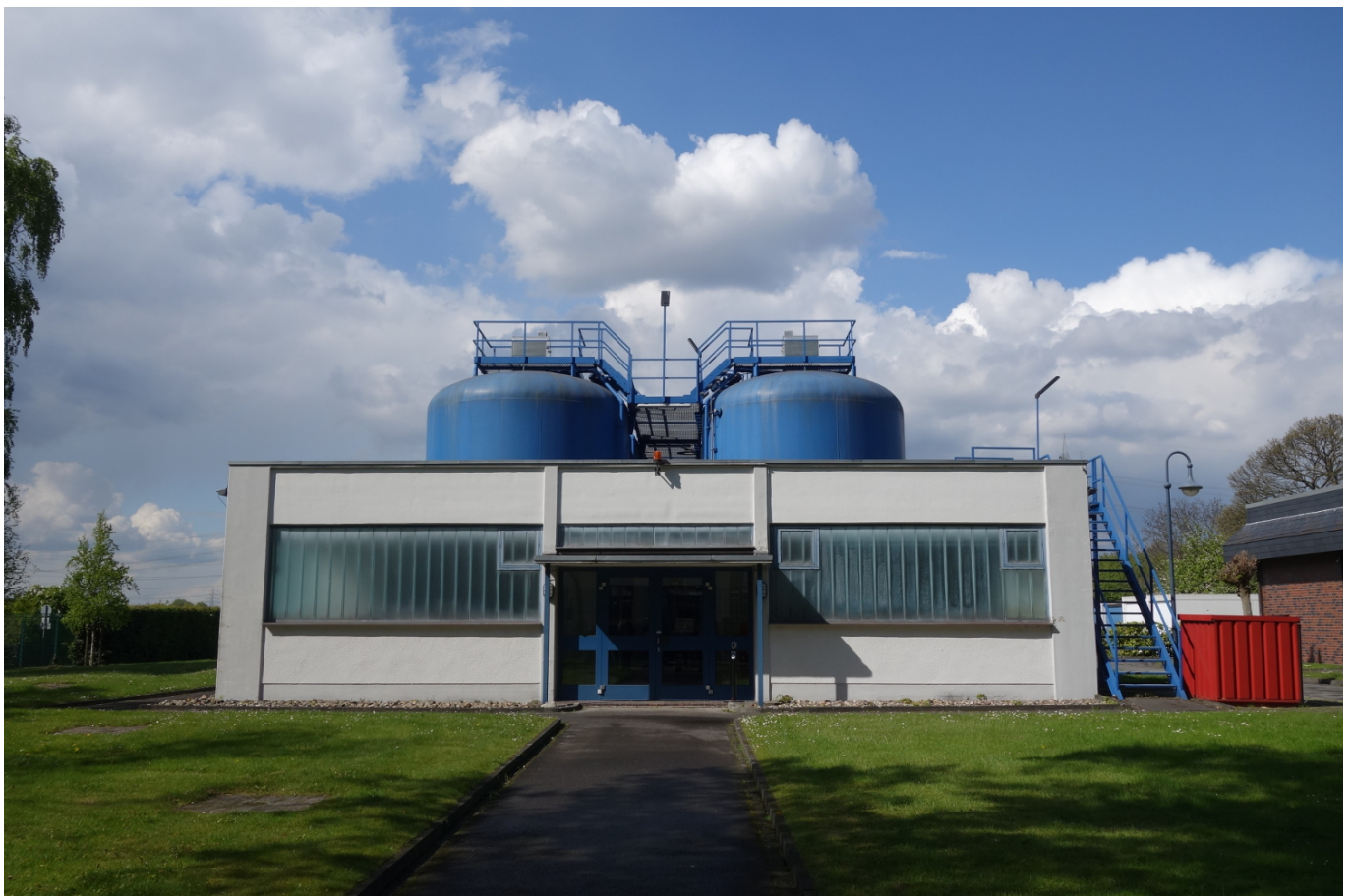
Das moderne Wasserwerk Bockum in Düsseldorf-Wittlaer

Das irrwitzige Wachstum, vor allem der Bevölkerung, brachte um 1910 herum das Problem der Wasserversorgung mit sich. Das damals einzige Wasserwerk an der Aakerfähre über die Ruhr zwischen Duisern und Meiderich konnte diese Versorgung allein nicht leisten. Also sahen sich die Stadtmütter und-väter nach einem Ort für ein zweites Wasserwerk um und fanden in Bockum, also knapp jenseits der Stadtgrenze, das geeignete Grundstück. Schon immer galt das Gebiet am Unterlauf der Anger als wasserreich, und so begann man 1912 mit für damalige Zeiten hochmodernen Maschinen das Grundwasser abzapfen und ins Duisburger Leitungsnetz einzuspeisen.