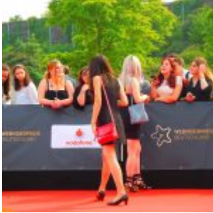
Die Fans am Roten Teppich