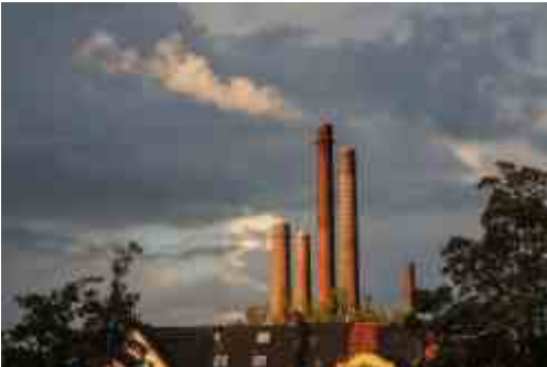
Reisholz: _ Henkel am Horizont