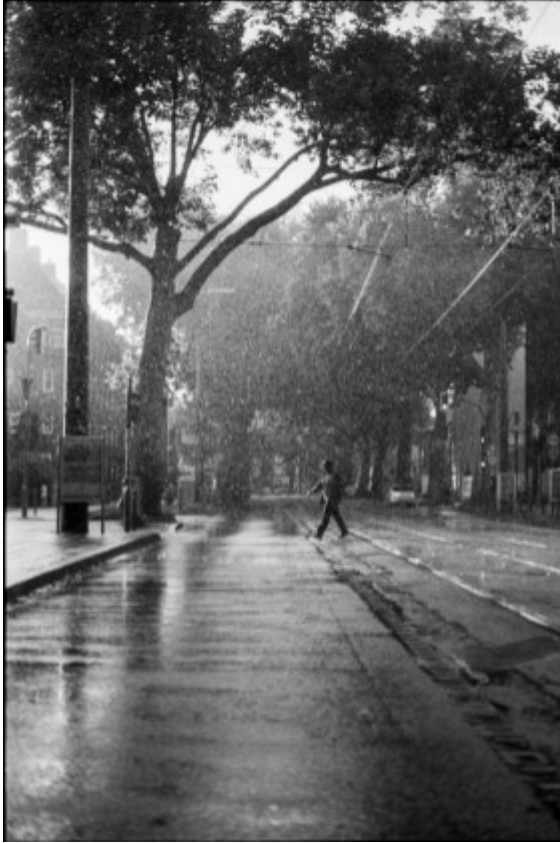
Platz 7: Bei Regen (Max Brugger)