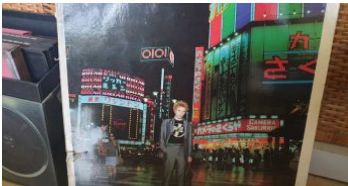
P.I.L. live in Tokyo – ganz anders

Ich kenne kaum einen Musiker, der seine musikalische Vergangenheit so schnell und konsequent hinter sich gelassen wie John Lydon aka Johnny Rotten. Als die Platte „Live in Tokyo“ rauskam war ich gerade 14. Und wir kannten ehrlich gesagt von PIL nur „This is not a lovesong“ mit der B-Seite „Public Image“. Und irgendwie klangen diese beiden Songs ja noch punkig, wobei Blue Water schon sehr experimentell und nervig war.