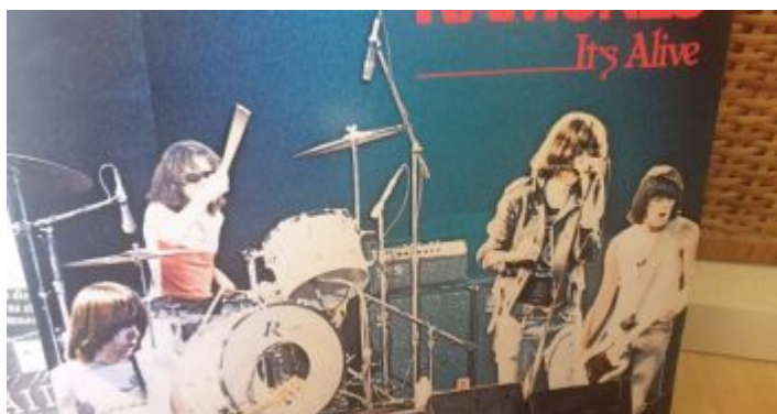
Ramones ihr Livealbum aus den späteren Tagen