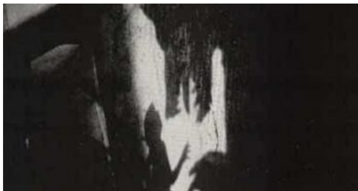
Neurotic Arseholes und ein Punkrock-Lovesong

Normalerweise poste ich ja immer die Covers, aber die Platte hatte ich schon vor Ewigkeiten und... diesen Song muss ich mal hervorheben. Wenn es einen frühen deutschen Punkrock-Lovesong gibt, dann den hier. Der war damals der absolute Dosenöffner... darf man das heute noch schreiben? Oder ist das prollig, sexistisch, stumpf? Wahrscheinlich alles und auch zurecht!! Aber bitte, liebe Frauen, Freundin, Freundinnen, Ex-Freundinnen, Ex-Gespielinnen und allesamt ewige Heldinnen... verzeiht, es ist ein Rückblick ins dunkelste Mittelalter. Aber unter uns... ihr wart selbstbewusst und... wolltet halt auch ab und na mal was anderes als