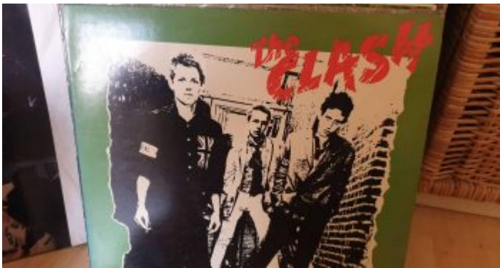
The Clash ... geht immer.