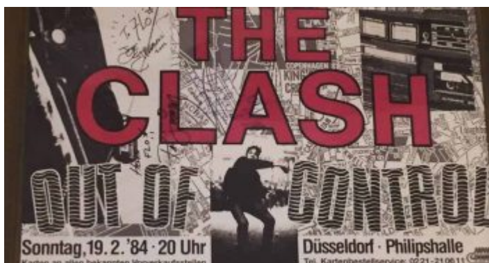
The Clash in der Philipshalle - das Ticket, eine Reliquie

die Scheibe dann zuhause aufgelegt und war angefixt! Meine Güte, was für eine Band, was für eine Scheibe. Die Band landete auf jedem Mixtape und ich nervte, wieder einmal, jeden in meiner Umgebung damit, was für eine megageile Band das sei. Wie zuvor mit Chelsea. Aber hey, wenn man jung und von einer Sache, einer Band, einem Buch oder einem Mädchen begeistert ist, dann soll es ja wohl auch jeder wissen. Und da wir damals noch nicht so viele Mädchen hatten und genauso wenig lasen, waren Bands eben das absolute Ventil. Und es gibt schlimmere Sachen als the only band, that matters.