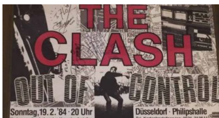
The Clash in der Philipshalle – das Ticket, eine Reliquie

die Scheibe dann zuhause aufgelegt und war angefixt! Meine Güte, was für eine Band, was für eine Scheibe. Die Band landete auf jedem Mixtape und ich nervte, wieder einmal, jeden in meiner Umgebung damit, was für eine megageile Band das sei. Wie zuvor mit Chelsea. Aber hey, wenn man jung und von einer Sache, einer Band, einem Buch oder einem Mädchen begeistert ist, dann soll es ja wohl auch jeder wissen. Und da wir damals noch nicht so viele Mädchen hatten und genauso wenig lasen, waren Bands eben das absolute Ventil. Und es gibt schlimmere Sachen als the only band, that matters.