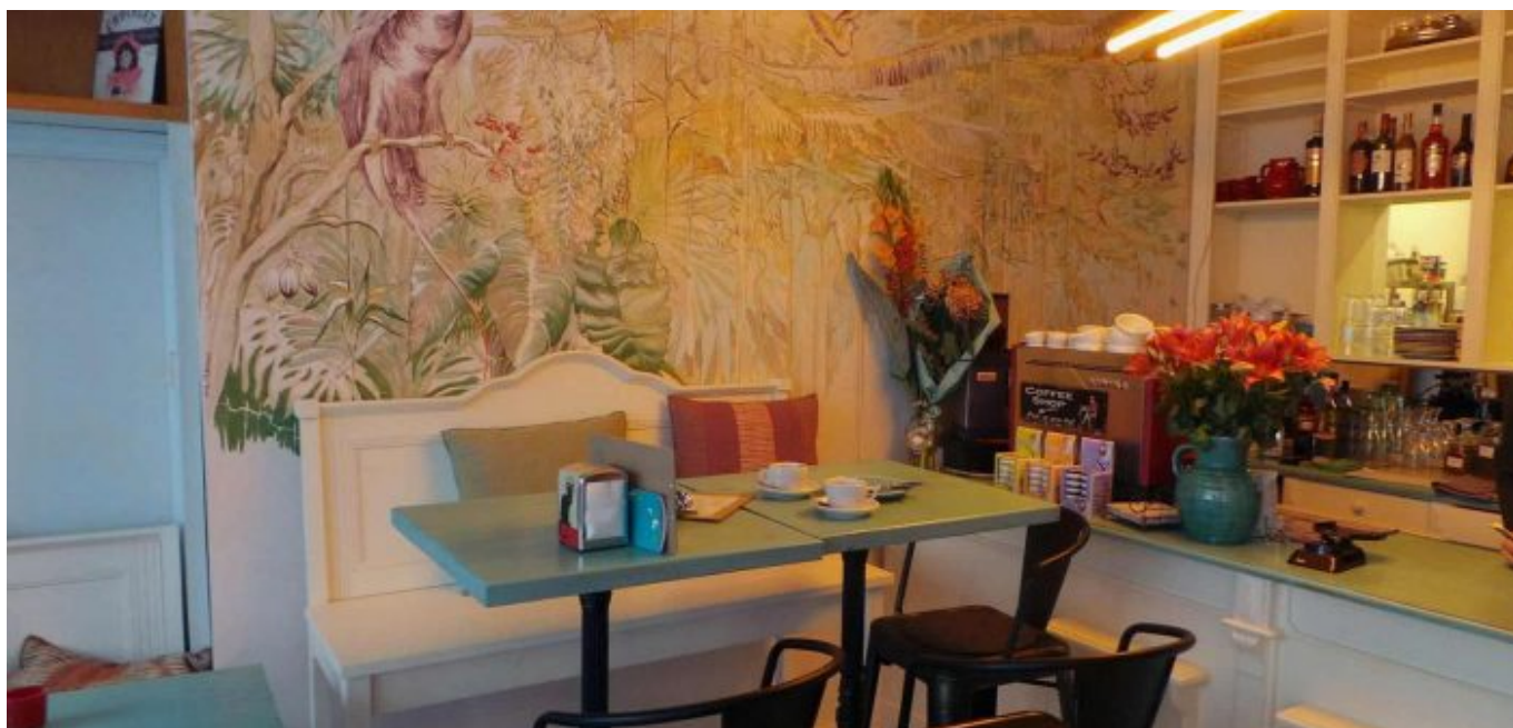
Das Interieur: Liebevoll zusammengestellt und farbenfroh

Einmal in der Woche, immer Freitags, wird im Wie im Himmel musiziert. Experimentelle Musik, Jazz oder Bossanova. Musikkonzerte in Wohnzimmerqualität, denn groß ist der zur Verfügung stehende Raum meist nicht. Dann herrscht konzertante Stimmung. Nach der Devise „klein aber fein“ geben sich ambitionierte Musiker ein Stelldichein. Während das Publikum den Klängen der Musik lauscht, genießen die Musiker die ungeteilte Aufmerksamkeit. Sie kommen gerne wieder und empfehlen den Ort weiter. Damit ist jetzt leider Schluss. Obwohl die Musik selber gar nicht so laut war. Vielleicht war es das Publikum, das störte? Weil es klatschte, weil es lachte?