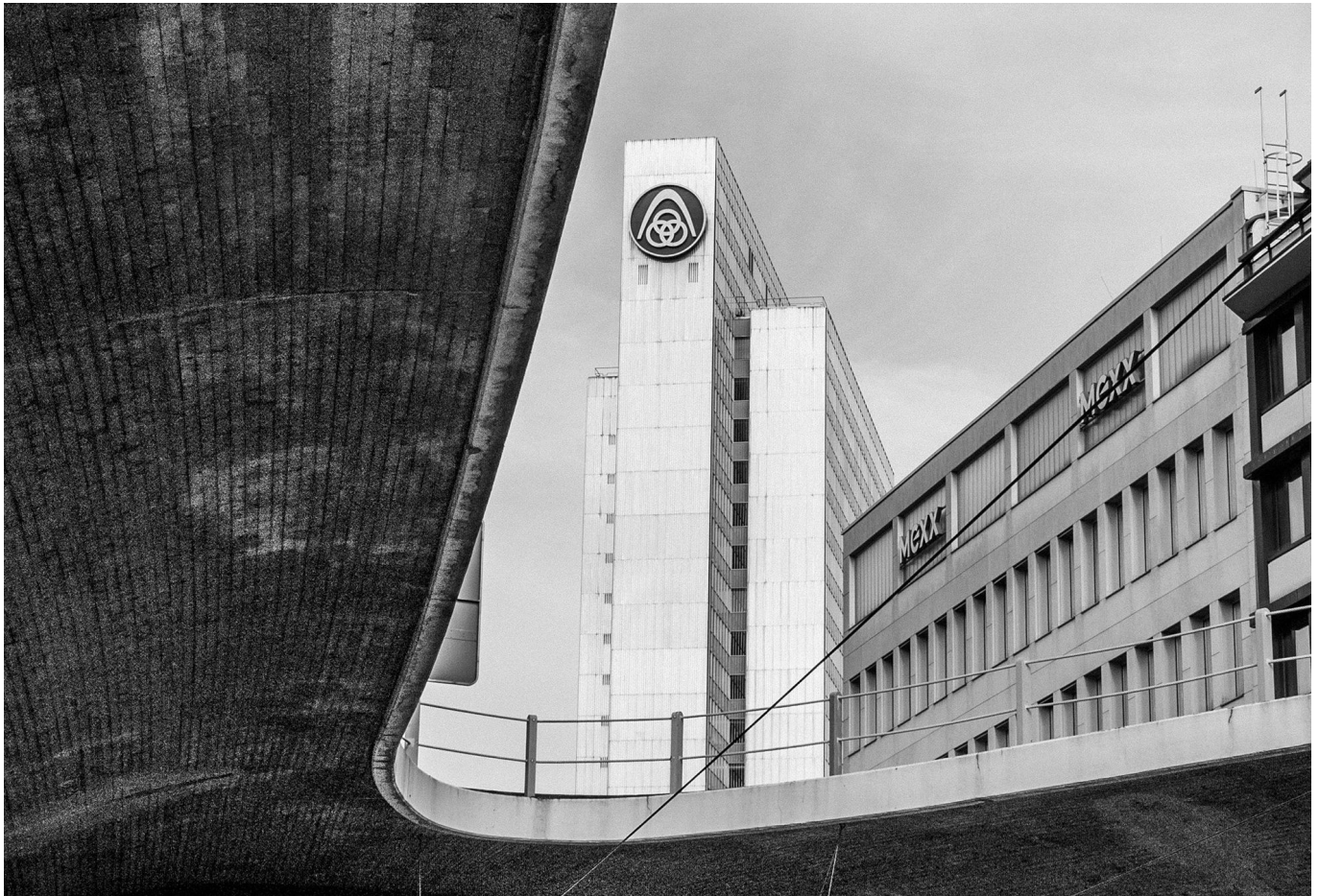
Tausendfüßler und Thyssenhochhaus (Ausschnitt;)

Weil Troost nur wenig Zeit blieb, Führeraufträge zu ergattern, hinterließ er nur in München ein paar architektonische Spuren. Hitler war sehr interessiert an Architektur und wünschten sich einen arisch-germanischen Baustil. Da passte Speers Vorliebe für den Neoklassizismus bestens. Denn dieser Baustil, der in den Zwanzigern noch als modern gegolten hatte, bot die Chance, Monumentalbauten angemessen zu gestalten. Schon bei den Bauten für das Reichsparteitagsgelände in Nürnberg hatte sich Speer im Sinne des Führers ausgezeichnet. Und nun hatte Hitler den passenden Mann für sein „Hobby“: die Umgestaltung Berlins in die Welthauptstadt Germania.