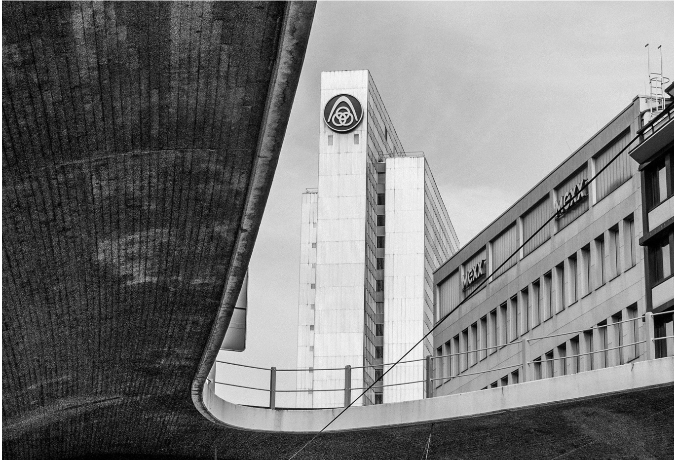
Tausendfüßler und Thyssenhochhaus (Ausschnitt;)

Weil Troost nur wenig Zeit blieb, Führeraufträge zu ergattern, hinterließ er nur in München ein paar architektonische Spuren. Hitler war sehr interessiert an Architektur und wünschten sich einen arisch-germanischen Baustil. Da passte Speers Vorliebe für den Neoklassizismus bestens. Denn dieser Baustil, der in den Zwanzigern noch als modern gegolten hatte, bot die Chance, Monumentalbauten angemessen zu gestalten. Schon bei den Bauten für das Reichsparteitagsgelände in Nürnberg hatte sich Speer im Sinne des Führers ausgezeichnet. Und nun hatte Hitler den passenden Mann für sein „Hobby“: die Umgestaltung Berlins in die Welthauptstadt Germania.