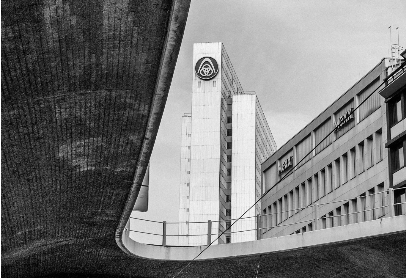
Tausendfüßler und Thyssenhochhaus (Ausschnitt;)

Weil Troost nur wenig Zeit blieb, Führeraufträge zu ergattern, hinterließ er nur in München ein paar architektonische Spuren. Hitler war sehr interessiert an Architektur und wünschten sich einen arisch-germanischen Baustil. Da passte Speers Vorliebe für den Neoklassizismus bestens. Denn dieser Baustil, der in den Zwanzigern noch als modern gegolten hatte, bot die Chance, Monumentalbauten angemessen zu gestalten. Schon bei den Bauten für das Reichsparteitagsgelände in Nürnberg hatte sich Speer im Sinne des Führers ausgezeichnet. Und nun hatte Hitler den passenden Mann für sein „Hobby“: die Umgestaltung Berlins in die Welthauptstadt Germania.