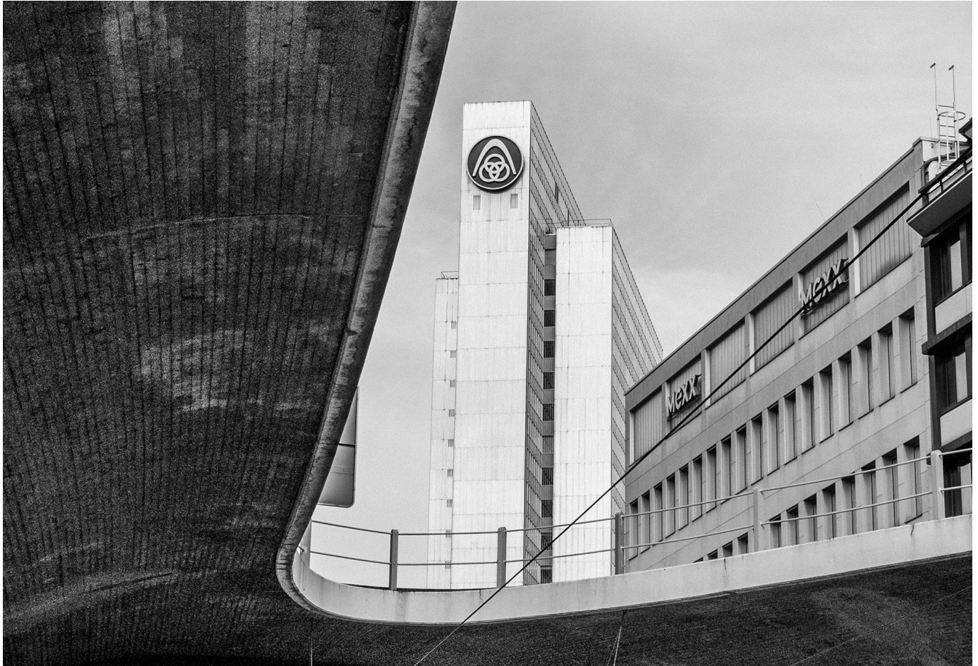
Tausendfüßler und Thyssenhochhaus (Ausschnitt;)

Weil Troost nur wenig Zeit blieb, Führeraufträge zu ergattern, hinterließ er nur in München ein paar architektonische Spuren. Hitler war sehr interessiert an Architektur und wünschten sich einen arisch-germanischen Baustil. Da passte Speers Vorliebe für den Neoklassizismus bestens. Denn dieser Baustil, der in den Zwanzigern noch als modern gegolten hatte, bot die Chance, Monumentalbauten angemessen zu gestalten. Schon bei den Bauten für das Reichsparteitagsgelände in Nürnberg hatte sich Speer im Sinne des Führers ausgezeichnet. Und nun hatte Hitler den passenden Mann für sein „Hobby“: die Umgestaltung Berlins in die Welthauptstadt Germania.