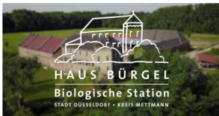
Biologische Station Haus Bürgel – hier werden auch Spatzen gezählt

Berlin ist immer eine Reise wert, besonders wenn man Spatzen mag. Frühmorgens im Frühling sind die noch stillen Straßen in allen Viertel erfüllt vom lauten Schilpen der Sperlinge . In den Biergärten und auf den Außenterrassen der Cafés belagern Dutzende dieser frechen Viecher jeden, der etwas isst. Und in Düsseldorf? In unserer schönen Stadt am Rhein sieht man kaum noch Spatzen, vor allem nicht in nennenswerter Anzahl. Dabei handelt es sich bei dieser Singvogelart um einen Kulturfolger, der schon seit über 10.000 Jahren besonders gern in den Städten der Menschen lebt. Tatsächlich ist die Zahl der Brutpaare in den letzten Jahren um gut ein Drittel zurückgegangen.