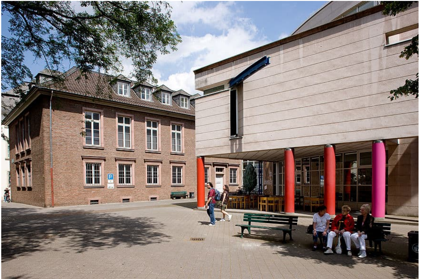
Das Stadtmuseum am Rande der Altstadt

Inzwischen steht die Frage im Raum, ob es überhaupt ein Neubau sein muss. Vorgeschlagen wurde, das Deutsche Foto-Institut im jetzigen Stadtmuseum an der Berger Allee unterzubringen und die zugesicherten Zuschüsse für den Umbau des leicht chaotischen Gebäudekomplexes einzusetzen. Der Bestand des Stadtmuseums könnte wiederum im neuen Haus der Geschichte am Mannesmannufer unterkommen, das ja fortlaufend modernisiert und erweitert wird.