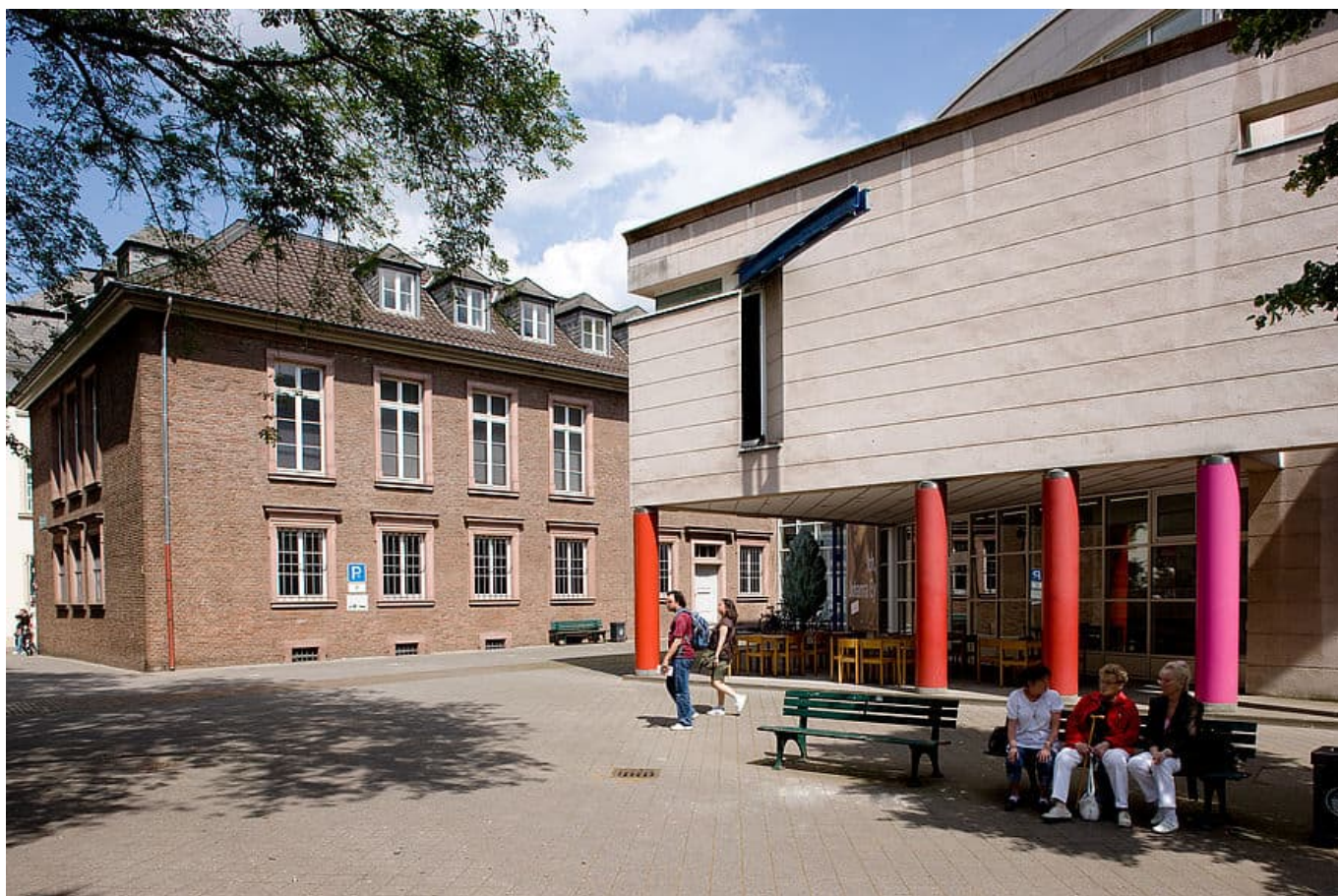
Das Stadtmuseum am Rande der Altstadt

Inzwischen steht die Frage im Raum, ob es überhaupt ein Neubau sein muss. Vorgeschlagen wurde, das Deutsche Foto-Institut im jetzigen Stadtmuseum an der Berger Allee unterzubringen und die zugesicherten Zuschüsse für den Umbau des leicht chaotischen Gebäudekomplexes einzusetzen. Der Bestand des Stadtmuseums könnte wiederum im neuen Haus der Geschichte am Mannesmannufer unterkommen, das ja fortlaufend modernisiert und erweitert wird.